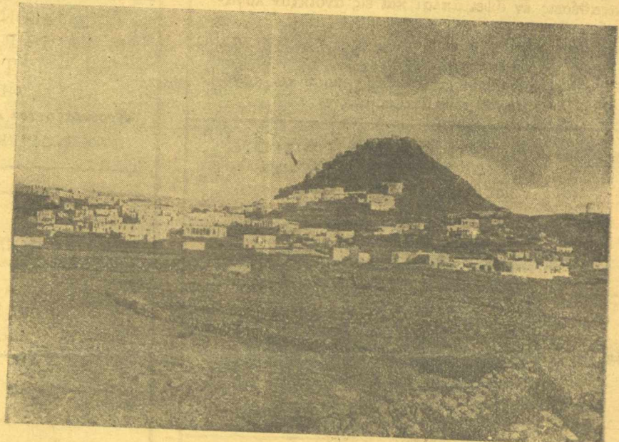
Πλάκα - ΜΗΛΟΣ