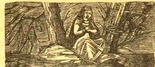
ΤΟ ΚΑΛΛΥΝΤΗΡΙΟΝ ΤΩΝ ΚΥΡΙΩΝ