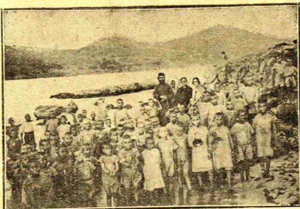
Τὰ ὄρφανά τοῦ ἐν Βουλιαγμένη Ἐκκλ. Ὁρφανοτροφείου