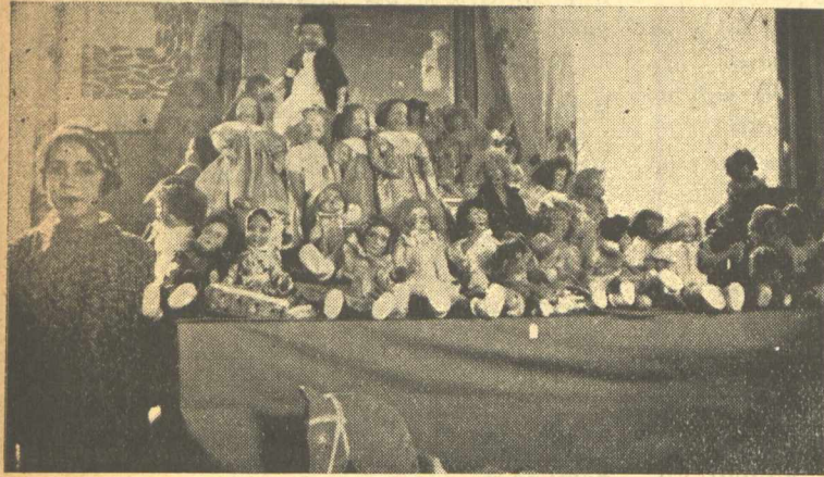
Ἐνα πλῆθος ἀπὸ κοῦκλες

Μὴ νομίζετε πὼς ἀστειεύομεθα: Τὰ παιχνίδια, ἀκριβῶς ὅπως καὶ οἱ ἄνθρωποι ἔχουν κι' αὐτὰ τὴν γιορτινὴ τους μέρα.