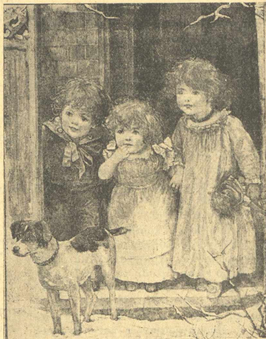
... περιμένουμε νὰ γυρίσῃ ὁ πατέρας.

Καὶ ξέρετε, θὰ σᾶς πῶ ἓνα μυστικό, θέλω νὰ γίνω ἴδιος μὲ τὸν πατέρα, σὰν μεγαλώσω.