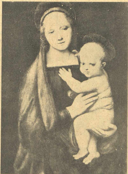
...Καὶ τὸ Θεῖο παιδάκι χαμογελοῦσε...

Πιὸ πέρα ἀπὸ τὸ κατασκήνωμα τῶν σοφῶν μάγων, μέσα στὸ πλῆθος τῶν σιλάβων καὶ τῶν καμηλιτέρηδων, μιὰ εὐγενικιὰ γυναίκα