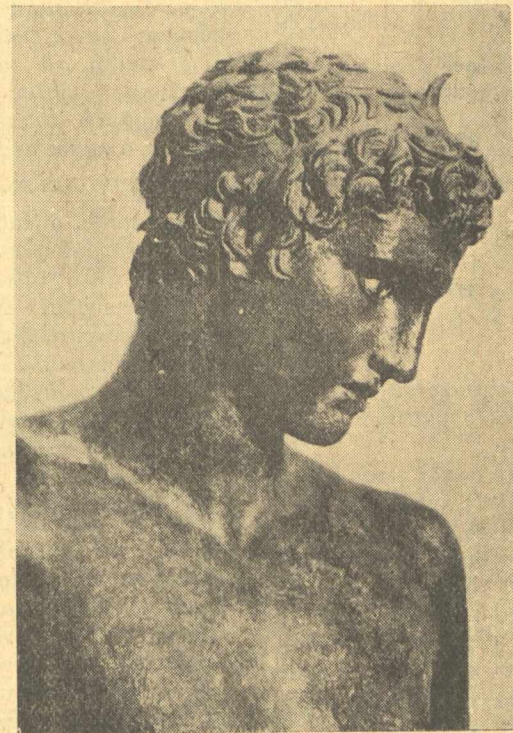
Τὸ παιδί τοῦ Μαραθῶνος

—Αὐτὸ τὸ ὠραῖο χάλκινο ἀγάλματάκι εἶναι γνωστὸ μὲ τὸ ὄνομα «Τὸ Παιδί τοῦ Μαραθῶνος». Βρέθηκε στὴ θάλασσα κ' αὐτὸ εἶναι ἀσφαλῶς ἔχει τὴν ἴδια ἱστορία ποὺ ἔχει καὶ ὁ «Ἐφρημος». ἔχει πνιγτὸ τὸ καράβι ποὺ τὸν μετέφερε στὴ Ρώμη. Παριστάνει ἕνα παιδί ποὺ κατὰ κρατεῖ στὸ ἀριστερὸ του χέρι καὶ ζυγίζει τὸ