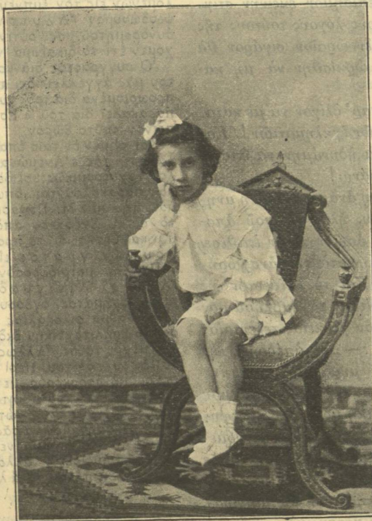
Ο μικροσκοπικός Μόζαρτ

Ἡ φύσις εἶχε καθήσυχάσει, ὁ οὐρανὸς ἔγεινε πάλιν κνανοῦς, ὡς