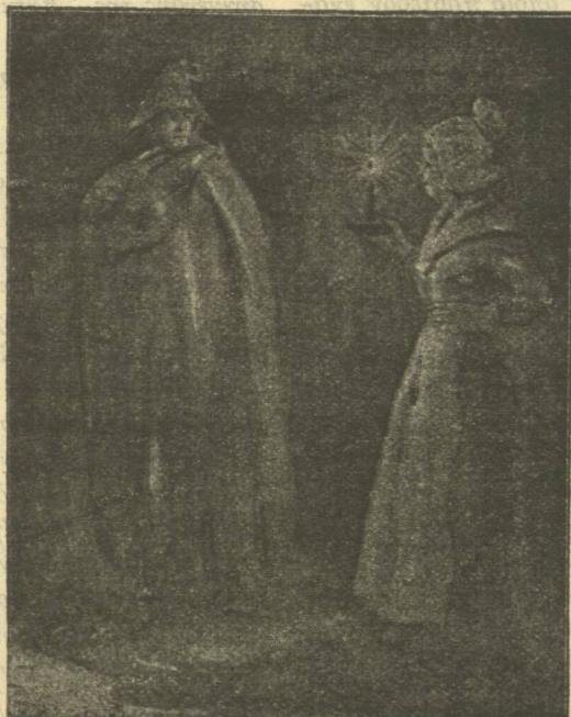
... Ὅπισθοχώρησεν ὡρὰ καὶ ἑπίμουςα (σελ. 69)

Ἡ νεᾶνις ἀκουσίως ἐγύρισε πίσω καὶ κατέβη εἰς ἓνα μονοπάτι, τὸ ὁποῖον ἔφερεν εἰς τὸ ἐσωτερικὸν τῆς χώρας. Ἐστρέφετο δειλὰ-δειλὰ γύρω τῆς καὶ συγχρόνως ἔσταμάτα καὶ ἠκροῶτο μὲ προσοχήν. Κανεὶς ἄλλος ἤχος δὲν ἐτάραττε τὴν νυκτερινὴν σιωπὴν παρὰ μόνον ἡ φωνὴ τῆς νυκτερίδος ἢ τὸ φτερούγισμα κανενὸς μικροῦ πτερωτοῦ. Ἀλλ' ὁ τρόμος τῆς νέας μετεμόρφωσε τοὺς μαύρους κορμῶν τῶν δένδρων εἰς κινούμενα πλάσματα καὶ τὸν ψιθυρισμὸν τῶν φύλλων εἰς συνομιλίαν λαθρεπι-