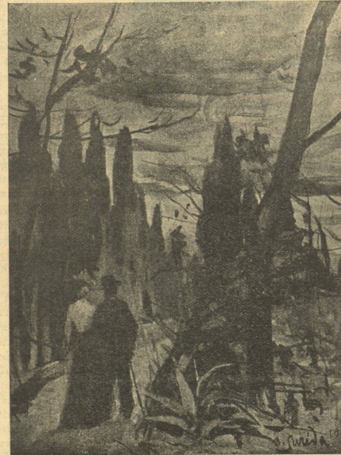
Αἱ κυρίαριοοι προσβάλλοντο ἐπὶ τοῦ ἰώδους βάλθους τοῦ ἐρίζοντος (Σελ. 25)

— Εἶνε πολὺ μακρὰν τοῦ ἐν Νικοίᾳ ἐργαστηρίου σας.