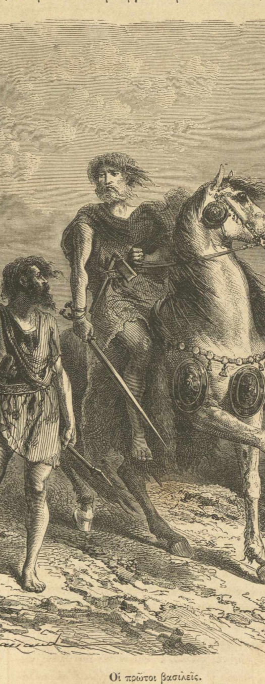
Οἱ πρώτοι βασιλεῖς.