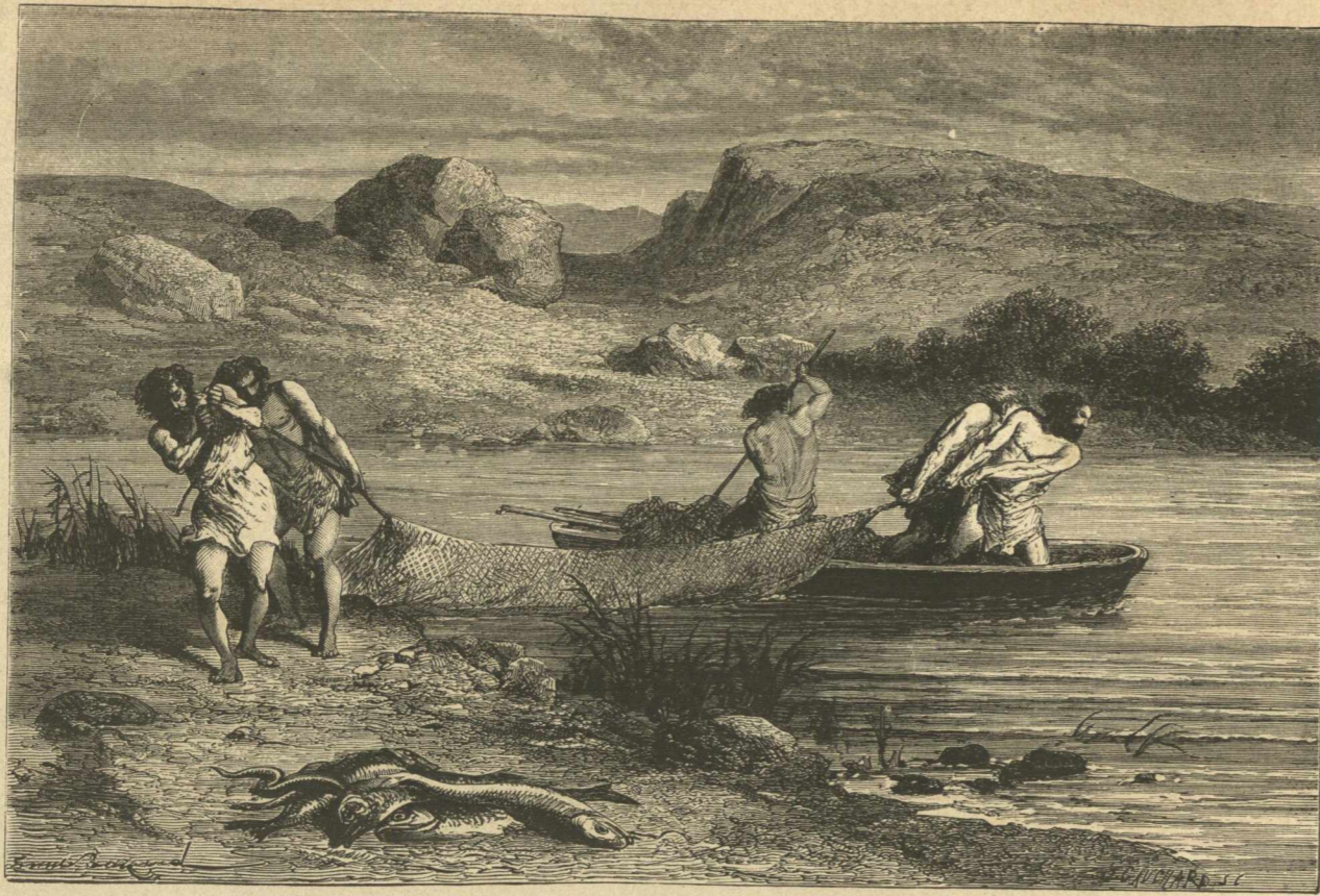
Οι πρώτοι αλιείς.