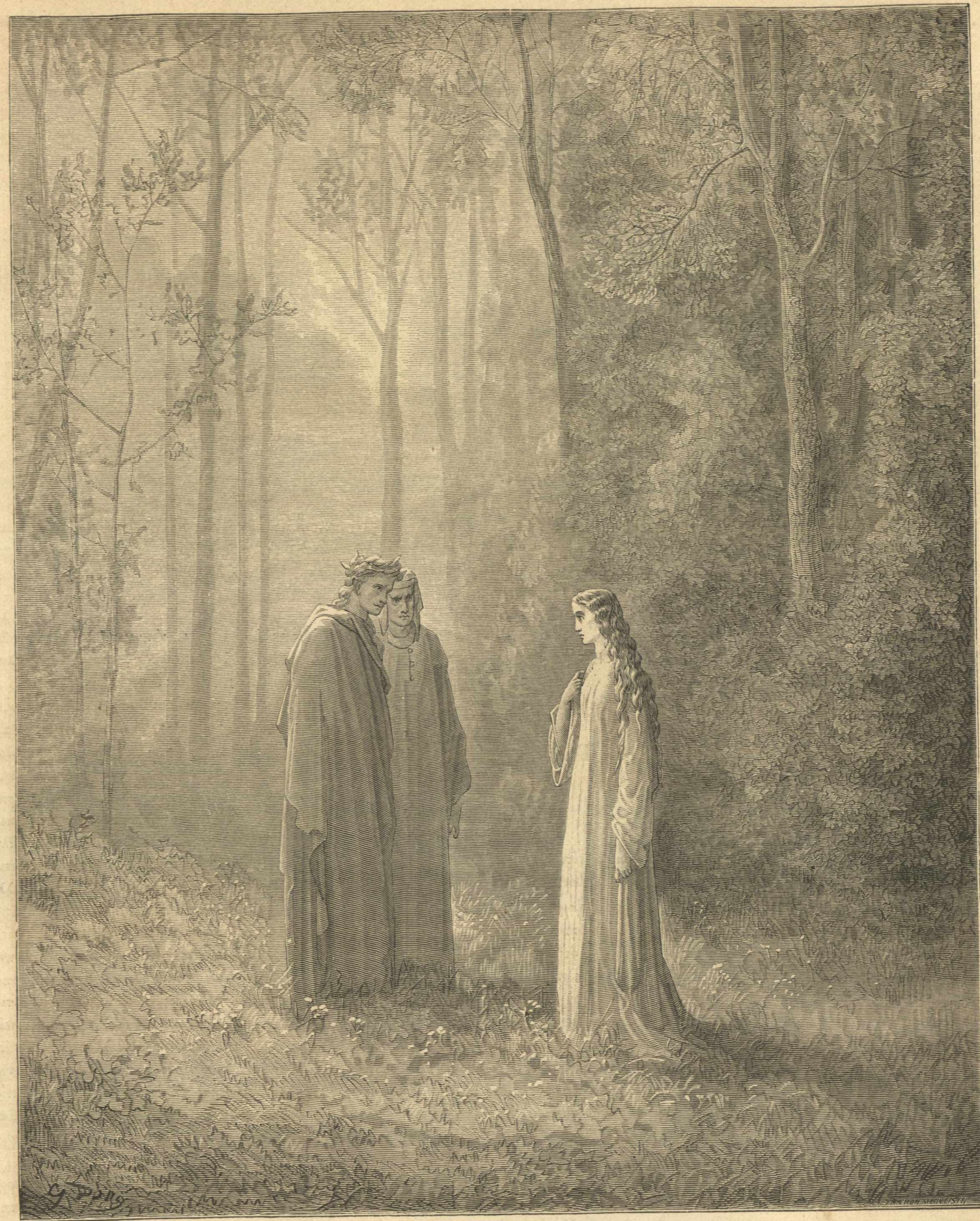
Ἡ τριλογία τοῦ Δάντου.—Τὸ Καθατήριον.

δεκαπέντε σταδία τῶν ὄχυρωμάτων τοῦ ἀρχαίου Βυζαντίου, ὅπερ περιέβαλλον πανταχόθεν κατὰ γῆν, παρετεινότο τοξοειδῆ ἀπὸ τῆς Προποντίδος μέχρι τοῦ βυθοῦ τοῦ λιμένος, καὶ ἀπετέλουσαν ὁμοίαν τρίγωνου, οὗτινος αἱ δύο ἄλλαι πλευραὶ παρεβρέοντο ὑπὸ τῆς θαλάσσης. Ἡ νέα πόλις εἶχε περίμετρον τεσσαρῶν περίπου λευγῶν. Ἐν αὐτῇ ἐξήρνοντο οἱ ἑπτὰ λόφοι οἱ ἀναμνησκόντες τοὺς ἑπτὰ λόφους τῆς Ὠμῆς, ἧς μετ' ὀλίγον ἡ νέα πόλις ἐμελλεν ἵνα κατασταθῇ κατὰ πάντα ἐνάμιλλος. Διότι πλὴν τῶν μνημείων τῆς εἰδωλολατρίας τῆς Ῥώμης, ἀνθ' ὧν ἰδρύθησαν ἐν αὐτῇ αἱ χριστιανικαὶ ἐκκλησίαι, ὁ κτίστης αὐτῆς ἐφιλοτιμήθη ἵν'