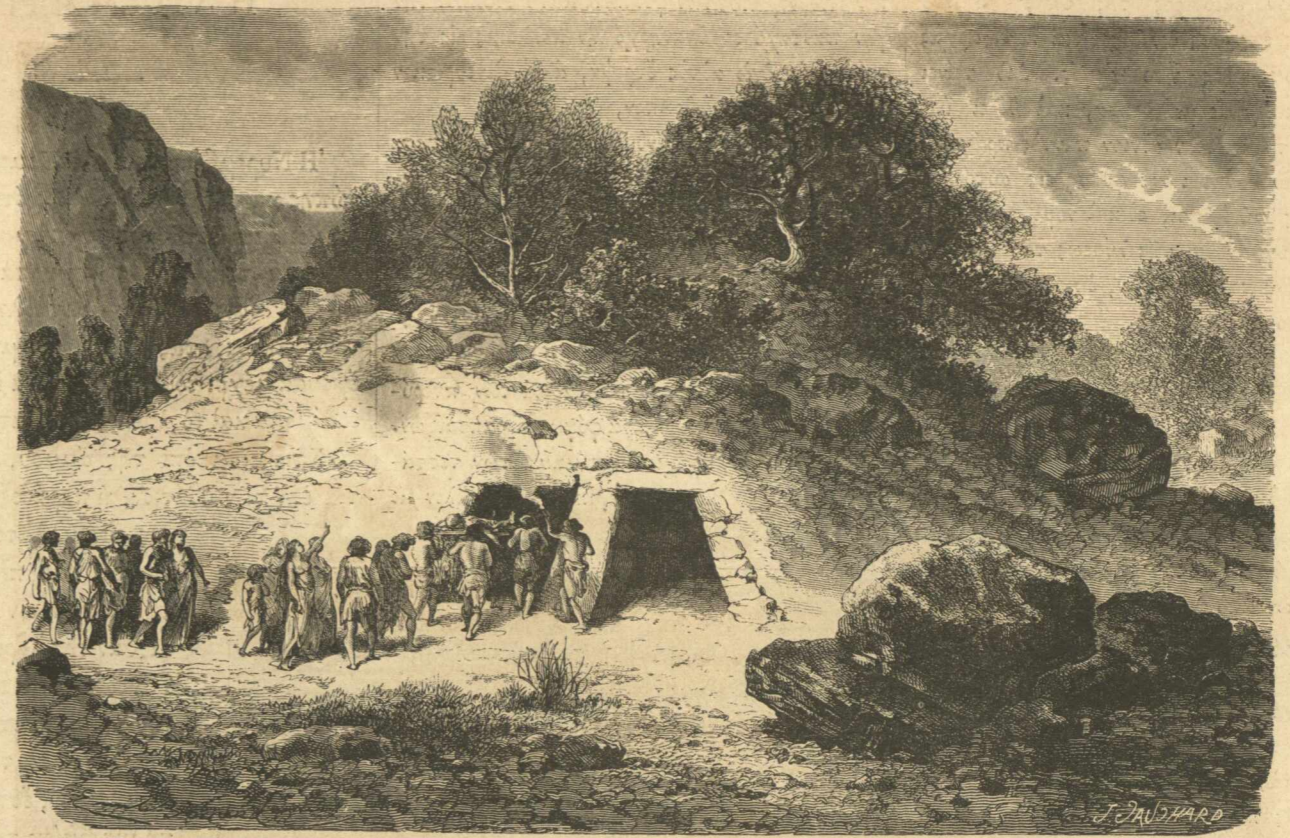
Ἐπικλήθει τελεταὶ παρὰ τοῖς πρώτοις ἀνθρώποις.