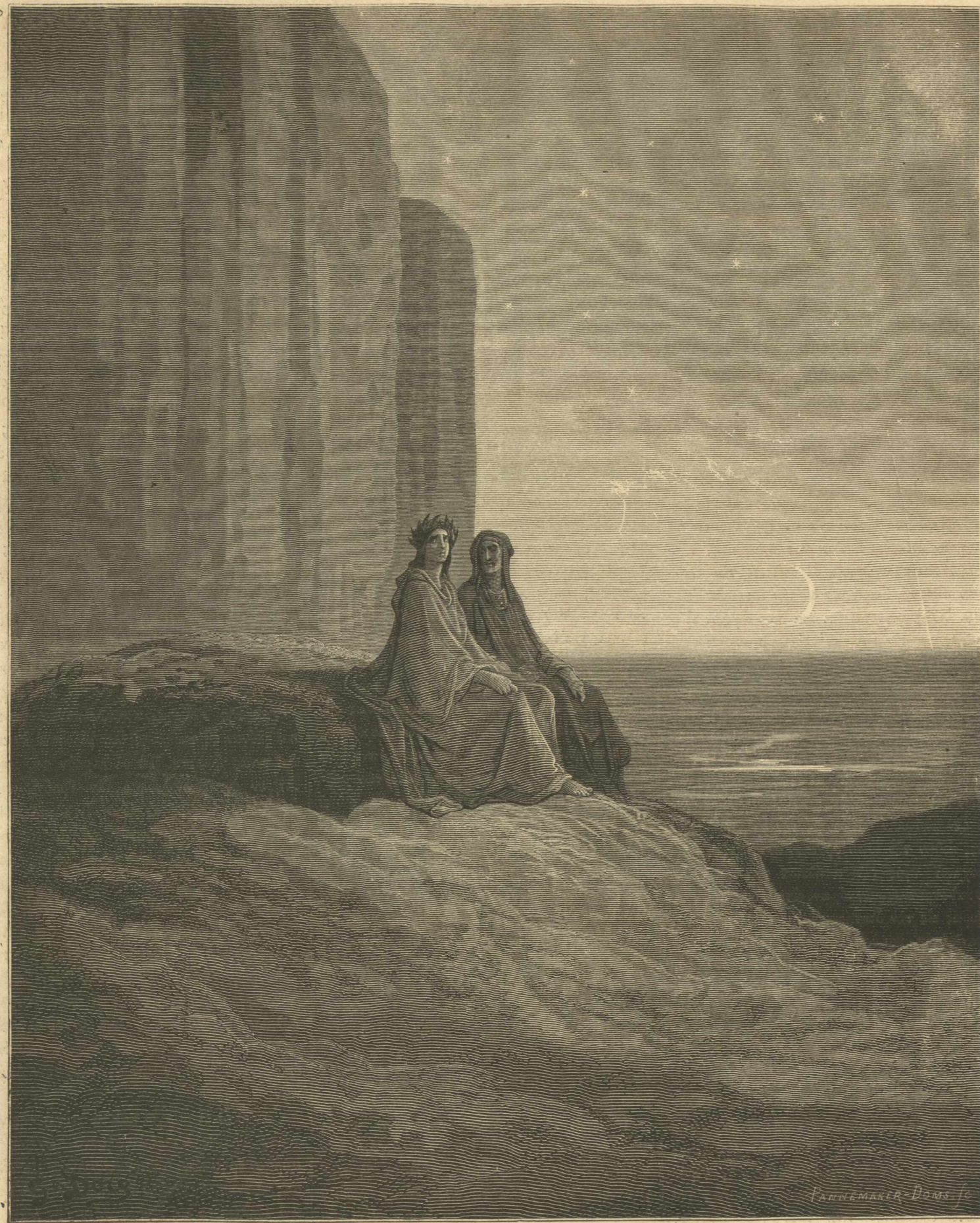
Ἡ τριλογία τοῦ Δάντου.—Τὸ Καθατήριον.

γειτνιάζει τῇ φιλοτέχνῳ Ἑλλάδι καὶ τῇ εὐφύρῳ Αἰγύπτῳ. Προσβαλλομένη δ' ἐκ τῶν πρὸς μεσημβρίαν ἢ βορρᾶν τόπων, δύναται ἵνα διακλείσῃ τοὺς πολεμίους τοῦ Ἑλλησπόντου διὰ τῶν φρουρίων τῆς Σηστοῦ καὶ Ἀβύδου. Τέλος δὲ εἶναι θαυμαστὸν ἐμπορεῖον, ὅθεν διεισδύονται τὰ ἐμπορεύματα ἔνθεν μὲν διὰ τοῦ Ἰστρου μέχρις εἰς τὴν μέσσην Εὐρώπην, ἔνθεν δὲ εἰς ἅσασαν τὴν Ἀνατολήν. Ἡ κατὰ γῆν καὶ κατὰ θάλασσαν παρὰ τοῦ Κωνσταντινοῦ εὐφύως ἐκλεγεῖσθαι αὕτη τοποθεσία ἦτο βεβαίως ἀξία ἵνα καταστή μνητρόπολις μεγάλης βασιλείας. Σημεῖον δὲ, ὅτι, εἰ καὶ πολλὰ ἔπαθεν ἡ Κωνσταντινούπολις ἐπὶ δεκαπέντε αἰῶνας, δια-