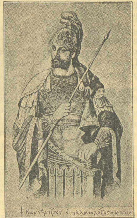
Κωνσταντῖνος ὁ Παλαιολόγος

νον πολιτισμὸν μαύρη σκοτόμαινα τῆς ἰσλαμικῆς βαρβαρότητος; Τὸ Ἑλληνικὸν Ἔθνος καὶ ἄλλοτε ὑπέκλυσε δοῦλον. Ξενικὸν σκῆπτρον ἐκυβέρνησε τὴν Ἑλλάδα καὶ ἄλλοτε, ὅταν αὕτη εἶχε μεταβληθῆ εἰς Ρωμαϊκὴν ἐπαρχίαν. Τί ἦτο ὅμως ἡ δουλεία ἐκείνη συγκρινομένη πρὸς τὴν ὑπὸ τὸν ζυγὸν τῶν Τούρκων συστηματικὴν ἐξόντωσιν! Δεθεῖς ἀγρίως μὲ ἀλύσεις ὁ Ἑλληνισμὸς, μὲ