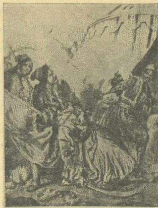
Ὁ Μάρκος Βότσαρης φρονεῖται νικῶν ἐν Καρπενήσιω.

νας εἰς τὴν μεγαλοεργὸν ἔθνικὴν ψυχὴν, ἡ ὁποία τὴν τέως πόθον καὶ ἐλπίδα Μεγάλῃν Ἰδέαν ἐνεσάρκωσεν εἰς χειροπτην πραγματικότητα, χάρις εἰς ἡρωϊκὰ κατορθώματα τῶν μαχητῶν μας τῶν ὁποίων ἡ ἐπιδεικνυομένη αὐταπάρησις διακηρύττει εἰς ὅλον τὸν πεπολιτισμένον κόσμον ὅτι «ἡ Ἑλλὰς προὐρίσται νὰ ζήσῃ καὶ θὰ ζήσῃ».