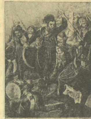
Νίκη τοῦ Μανρομιχάλη εἰς Λακωνίαν περὶ Βέργαν.

Ἀπὸ κάθε σῶμα ἐξηντημένον μετὰ δουλείαν τόσον καταπονητικὴν καὶ τόσον πολυχρόνιον ὁ κόσμος μετὰ ἐκπλήκτους ὀφθαλμοὺς ἐβλεπε νὰ ἐκπηδᾷ καὶ ἀνὰ εἰς τιτάνειος γίγας μετὰ ψυχὴν λεοντόθυμον, ἕκαστος δ' Ἕλληνα πολεμιστῆς ἦτο εἰς τὸν κύκλον τῆς δράσεώς του καὶ εἰς Κανάρης, εἰς Μιαούλης, Κολοκοτρώνης καὶ Λιάκος, μετὰ τοὺς ὀδόντας καὶ τοὺς ὄνυχας τὰς ἀλύσεις τῆς δουλείας του θραύων καὶ μετὰ τὸ πῦρ τοῦ μένου του καυτηριάζων τὰς κεφαλὰς τῆς τουρκικῆς τυραννικῆς ὕδρας.