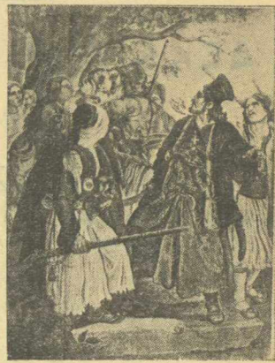
Ο Λιόκος καλεῖ τοὺς Περισσομένους εἰς τὰ ὄπλα.

δικήσεως, τρεφόμενον ἀπὸ τὴν ἐμφύχωσιν τῶν Κοραϊδῶν, ἀπὸ τὰ θούρια τῶν Φεραίων, ἀπὸ τὸν θερμοργὸν πατριωτισμὸν τῶν φυλακῶν, ἀπὸ τὴν ἀγγόνην Γρηγορίου τοῦ Ε', ἀνεπήδησεν ἀκράτητον καὶ ἀνόπλιον τὸ γλυκερὸν τῆς ἐλευθερίας ὄραμα, τὸ ὁποῖον ἐνεσάρκωσεν εἰς πραγματικότητα ἢ ὑπὸ τοῦ Πατρῶν Γερμανοῦ ὑψωθείσα σημαία τῆς Ἑλληνικῆς Ἐπαναστάσεως.