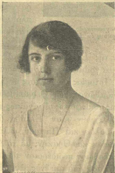
Η Α. Υ. ΠΡΙΓΚΗΠΙΣΣΑ ΞΕΝΙΑ Δευτερότοκος θυγάτηρ τῆς Μ. Δουκίσσης Μαρίας ἐτῶν 18.