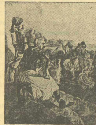
Ο Κολοκοτρώνης ὑπερασπίζεται τοὺς Μόλους καὶ τὴν Λέγναν.

Ποῖος τώρα θὰ ψάλλῃ ἐπαξίως τὴν ἀπαράμιλλον ἐκείνην ἐποποιίαν τῆς ἑλληνικῆς τόλμης καὶ ἀνδρείας, τῆς ἀδαμάστου εἰς αὐτοθυσίαν ἐτοιμότητος, τὸ ἑπταετὲς ἐκεῖνο ἔκπαυλον θαῦμα, κατὰ τὸ ὁποῖον ἀνεγεννᾶτο ἀπὸ τὴν τέφραν ὁ Ἑλληνικὸς Φοῖνιξ; Κατάπληκτα ἔμμενον τὰ ἔθνη πρὸς μεγαλοψυχίας ὁποία ἢ τῶν Σουλιωτῶν, πρὸ αὐτοθυσίας ὁποία ἢ τοῦ Σαμουήλ, πρὸ καταφρονήσεως τοῦ θανάτου ὡς ἢ τοῦ χοροῦ τοῦ Ζαλόγγου, πρὸ κατορθωμάτων ἀνηκούστων καὶ ἀπιστεύτων μᾶς δρακὸς ἀνισχύρων, ἀβοηθήτων καὶ ἐξησθενημένων ραγιάδων κατὰ μᾶς πανισχύρου καὶ δι' ὅλους τρομερᾶς αὐτοκρατορίας.