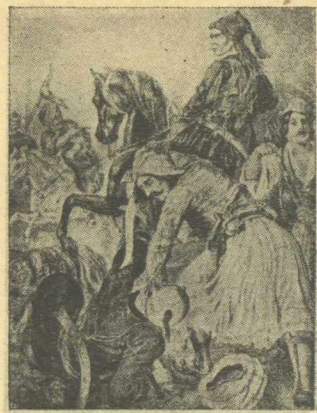
Ἀνδρέας Μεταξᾶς νικᾷ τοὺς Λαλιώτας.

βοσκορείων κυμάτων κατ' εὐθείαν εἰς τὸν ναὸν τῆς Ἁγίας Σοφίας, διὰ τὴν ἐναποθέσιν τὸ περιπαθὲς τοῦ Παρθενῶνος τῆς Ἀκροπόλεως φίλημα τῶν πέντε αἰώνων τοῦ χωρισμοῦ εἰς τὰς παρειὰς τῆς χριστιανικῆς Ἀκροπόλεως μας, τὴν ὁποίαν ὑπεσχέθη ἰδικὴν μας πάλιν ἢ γλυκεῖά μας Θεοτόκος (μετ' χρόνους) καὶ (μετ' καιροῦς).