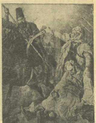
Θάνατος τοῦ Κωνσταντίνου Πελεμπᾶ.