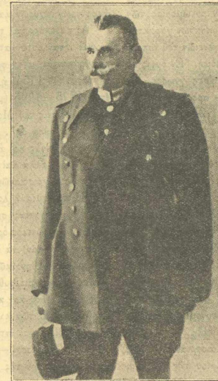
Ο ΣΤΡΑΤΗΓΟΣ Α. ΠΑΠΟΥΛΙΑΣ

ΚΑΘ' ἣν στιγμὴν ἐπιστεύετε εὐλόγως, ὅτι ἡ ἐν Παρισίοις ὑπογραφεῖσα Συνθήκη τῶν Σεβρών ἔχει μόνον ἔσθετε τέρμα εἰς τοὺς τελευταίους ἀγῶνας τῆς Ἑλλάδος, δι' ὧν ἠσφαλιζόντο τὰ δίκαιά της, ἀλλὰ καὶ διήνοιγεν ἐδωρτέρους ὁρίζοντας, εἰς τὸ βέβαιον τῶν ὁποίων διεκρίνοντο αἱ ἀνταρξίαι τῆς προσεχέστατης πραγματώσεως τῶν ὀνείρων τῆς Ἑλληνικῆς φυλῆς, ἐπὶ τὴν γενομένην, τὰ ὁποῖα ἀνεπίστως ἀνέτρεψαν τοὺς δικαίους μας ὑπολογισμούς. Αἱ Σύμμαχοι Δυνάμεις ἐνόμισαν ὅτι μετεβλήθησαν οἱ ὅροι τῶν κοινῶν μετὰ τῆς Ἑλλάδος ἀγῶνων, καὶ ταχέως ἐγνώσθη ὅτι ἐπίκειται ἡ ἀναθεώρησις τῆς Συνθήκης τῶν Σεβρών. Ἡ ἀποψὶς τῆς ἀναθεωρήσεως ὑπεστηρίζετο ἐπιμόμως ὑπὸ δύο ἐκ τῶν Συμμάχων, ἀδιάφορον ἂν ἐπλήττοντο εἰς τὰ καίρια τὰ κτηθέντα διὰ τῶν θυσιῶν ἑλληνικὰ δικαιώματα. Δυστυχῶς ἡ ἐν Λονδίῳ τελευταία Συνδιάσκεψις τῶν Συμμάχων κατέληξεν εἰς τροποποιήσεις τῆς Συνθήκης τοιαύτας, ὡστε ν' ἀναγκασθῇ ἡ Ἑλλὰς νὰ λύσῃ μόνη τῆς τὸν ἀνατολικὸν γόρδιον. Ἡ διὰ τῆς συναφθείσης μεταξὺ τῆς Γαλλίας καὶ Κεμαλικῆς Τουρκίας συμφωνίας δημιουργηθεῖσα ἐν Μικρᾷ Ἀσίᾳ κατάστασις, ἐξηγνάγκασε τὴν Ἑλλάδα νὰ ἀναλάβῃ τὰς κατὰ τῶν Κεμαλικῶν δυνάμειν ἐπιθέσεις, διὰ νὰ προλάβῃ τὴν μετ' αὐτῶν ἔνωσιν τῶν ἐκ Κιλικίας τουρκικῶν στρατευμάτων, οὕτω δὲ τὸ ἔθνος ἀπεδόθη εἰς νέον πόλεμον.