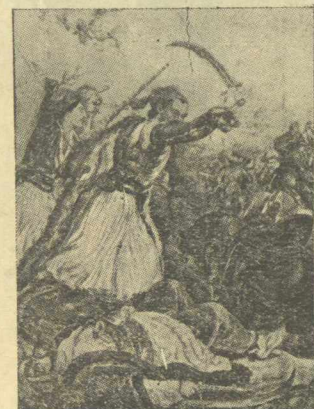
Ο Ἀναγνωσταρᾶς νικᾷ τοὺς Τούρκους ἐν Βαλκείσῳ.