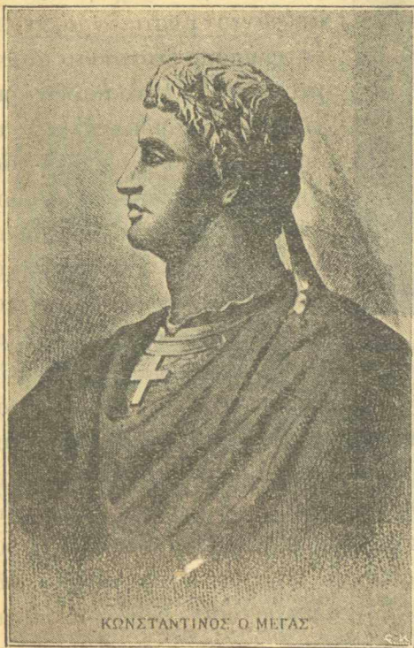
ΚΩΝΣΤΑΝΤΙΝΟΣ Ο ΜΕΓΑΣ

Πρὸ τετρακοσίων ἐξήκοντα καὶ ὀκτὼ ἐτῶν ἀκριβῶς, μετὰ μίαν συνεχῆ χιλιετηρίδα ἐκπάγλου ἀκμῆς καὶ δυνάμεως καὶ δόξης, μίᾳ ἀπὸ τὰς μεγαλειωδεστέρας φάσεις τοῦ Ἑλληνικοῦ πολιτισμοῦ ἐκλείετο ἀποτόμως, συμπνιγομένη ἀπὸ τὴν πλήμυραν μιᾶς βαρβαρότητος, τῆς ὁποίας στυγνοτέραν οὐδεμίᾳ ἐσημείωσεν Ἱστορία. Τὸ ἐκπροσωποῦν τὸν πολιτισμὸν ἐκεῖνον μεγαλοπρεπῆς Βυζάντιον, τὸ ὁποῖον ἐπὶ τῆς διδύμου ἀκτῆς τοῦ Χρυσοῦ Κέρατος ἐπηξε καὶ ἤγειρε καὶ ἐκάλλυνεν ἡ τοῦ Μεγάλου Χριστιανοῦ αὐτοκράτορος Κωνσταντίνου σοφὴ περι-