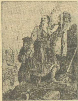
Ο Κεφαλῆς ὑψώνει τὴν σημαίαν ἐπὶ τῶν τειχῶν τῆς Τριβιζάνδας.

Πῶς βαθμηδὸν καὶ κατ' ὀλίγον τὸ πῦρ τοῦ ἀποκρύφου ἐκείνου πόθου ἐχώνευε τὸν σίδηρον τῶν τυραννικῶν ἀλύσεων καὶ ἐμεγάλωνεν εἰς παμφάγον πυρκαϊὰν τὴν θερμοργὸν ἑλληνικὴν πίστιν, γνωρίζομεν ἀπὸ τὴν πικρὰν, ἀλλὰ καὶ μοναδικὴν ἐν τῇ ἱστορίᾳ τῶν Ἐθνῶν ἱστορίαν τοῦ ὑποδούλου Ἑλληνισμοῦ. Ὀλόκληρος ἡ δούλη Ἑλλάς ἀπέβη ὑπὸ τὴν αἰγίδα τῆς Ἐκκλησίας τῆς ἀπέραντον μυστικῶν χαλκίων, ἐν τῇ ὁποίᾳ ἔτινοντο αἱ ψυχὰι τῶν Ἑλληνοπαίδων διὰ τῆς ἐθνικῆς διδασκαλίας, τὰ κρυφὰ δὲ σχολεῖα καὶ οἱ νάρθηκες τῶν ἐκκλησιῶν ἐχρησίμευον ὡς ἱεραὶ κολυμβήθραι, εἰς τὰς ὁποίας ἐβαπτίζοντο αἱ ἑλληνικαὶ γενεαὶ μετὰ τὰ νάματα τῆς ἑλληνικῆς σοφίας καὶ μετὰ τὴν ἐνεργὸν πίστιν εἰς τὴν ἀνάκτησιν τῆς παμποθήτου ἐλευθερίας. Κάθε δάκρυ διαυλακῶνον τοῦ ἱερέως, τοῦ διδασκάλου καὶ τῆς γραίας μάμμης τὴν παρειὰν διὰ τὸ δούλειον ἡμᾶρ, κάθε στεναγμὸς καὶ κατάρα, κάθε ἄσμα καὶ νανούρισμα ἦτο καὶ μία δημιουργία ἐκδικήσεως διὰ τὴν χαμένην ἐλευθερίαν, ἐν ἰσχυρὸν σφυρηλάτημα τῆς πίστεως εἰς τὴν ἀσφαλῆ παλιγγενεσίαν. Καὶ τὴν πίστιν αὐτὴν ἐνίσχουν καὶ ἐκράτουν ἀκόμη περισσότερο τὰ ἀνεκδιήγητα τῶν τυράννων βασιανιστήρια, τὸ ἀπαίσιον παιδομάζωμα, αἱ φυλακίσεις, οἱ δαρμοὶ καὶ οἱ ἐξευτελισμοὶ τῶν ραγιάδων, οἱ ἀπαγχονισμοὶ, οἱ ἀποκεφαλισμοὶ καὶ οἱ πνιγμοὶ τῶν προκρίτων καὶ τῶν κληρικῶν. Δὲν ἔμεινε γῆ καὶ δὲν ἔμεινε θάλασσα, ἡ ὁποία νὰ μὴ κρύπτη μαρτυρικὰ ἑλληνικὰ κόκκαλα. Καὶ ἀπ' τὰ κόκκαλα τῶν Ἑλλήνων τὰ ἱερά) ἐκεῖνα, τὸ μῖσος τῆς ἑλληνικῆς ἐκ-