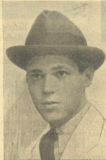
Ο Χ. ΑΗΔΣ Υἱὸς τῆς Πριγκηπισσῆς Ἀναστασίας ἐτῶν 19.