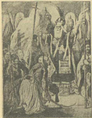
Ο Παλαιὸν Πατρὸν Γερμανὸς εὐλογεῖ τὴν σημαίαν τῆς ἐλευθερίας τῆ 2 Ἀπριλίου 1821.

Καὶ ἐνῶ οἱ φυγάδες τοῦ δούλου πλέον Βυζαντίου μετελαμπάδευον τὸ φῶς τοῦ ἑλληνικοῦ πνεύματος εἰς τὰς βαρβάρους χώρας τῆς Ἑσπερίας, οἱ δὲ Βαβυλώνιοι καὶ Πιλάται, οἱ Χρυσολοράδες καὶ Πλήθωνες, οἱ Γαζήδες, οἱ Λασκάρεις, οἱ Χαλκοκονδύλοι καὶ τόσοι ἄλλοι Ἕλλη-