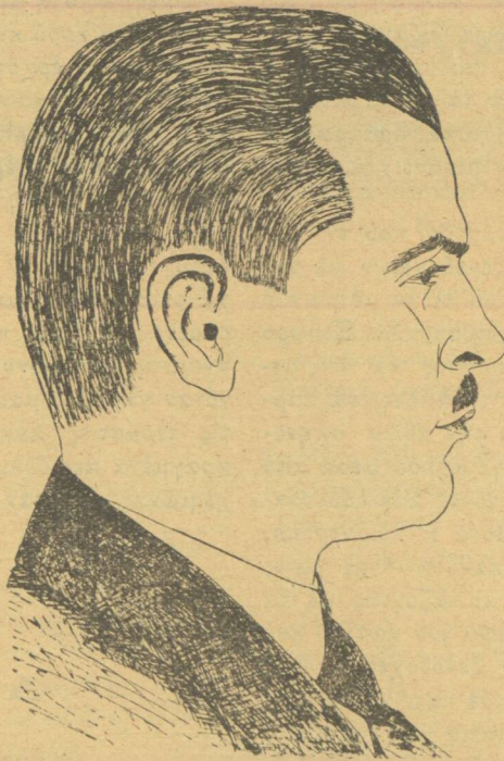
Α. Δ. ΠΑΠΑΔΗΜΑΣ (Σκίτσο Δημοπούλου)

Όσο έρχόμουν προς τήν πόλη τόσο ή θόρυβος του δρόμου ζωήρευε· δλος έκείνος ή κόσμος που πέρναγε πλάι μου μιλούσε για το φαί με λαιμαργία παιδιού, άνακατεύοντας όνόματα φαγιών, που είταν λησημονημένα πιά από τις πρώτες μέρες τής στέρησης... Γυναίκες έφερναν εύλαθητικά τις μερίδες του μαύρου λασπωμένου ψωμιού φλυαρώντας, σά να κράταγαν κάποιο πολύτιμο πράμα, που τους είχαν έμπιστευτεί—σ' δλων τις δψες ή ανεπάντεχη κ' ή άδυσώπητη ξένη είχε βάλει τή σφραγίδα της με μιάν άόριστη έκφραση μουγγής διαμαρτυρίας. Το ρολόγι του σταθμού έδειχνε έννέα και πέντε.