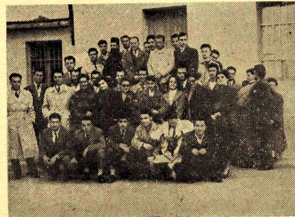
Μία μὲν τῶν ἰδρυτικῶν μελῶν τῆς ΕΦΕΠΘ κατὰ τὴν πρώτην τους συνέλευσιν.