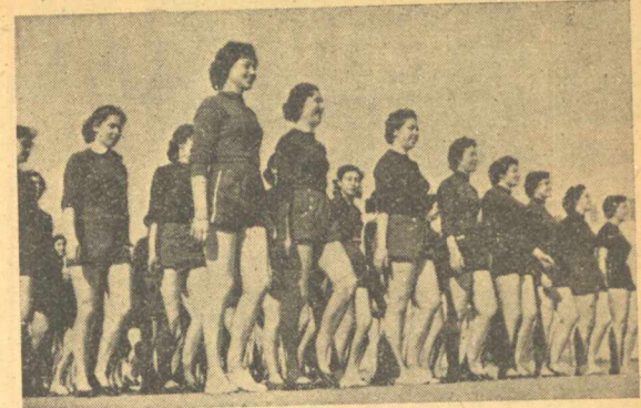
Τὰ έλληνικά νειάτα, ή αυριανή έλλίδα της πατρίδας.