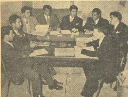
Τό καινούργιο Διοικ. Συμβούλιο της Ε.Φ.Ε.Π.Θ.

Ύστερα από τὰ δυστυχήματα πού σημειώθηκαν στην πλατεία Συντριβανιού, ή ΕΦΕΠΘ ζήτησε από τό Τμήμα Προχαίας Κινήσεως την χάραξη διαβάσεων και την τοποθέτηση τροχοτόμου.