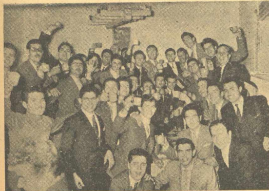
Χριστουγεννιάτικο γλέντι στην φοιτητική λέσχη.

Μόλις έγινε γνωστή ή σύλληψη των 28 συναδέλφων μας, ή ΕΦΕΠΘ κινήθηκε δραστήρια προς όλες τις κατευθύνσεις. Ειδοποίησε τους συγγενείς των συλληφθέντων, φρόντισε για την διατροφή των κρατούμένων και ένήργησε στον Δίκηγορικό σύλλογο για να έπιτύχη Ικανοποιητική ύπεράσπιση.