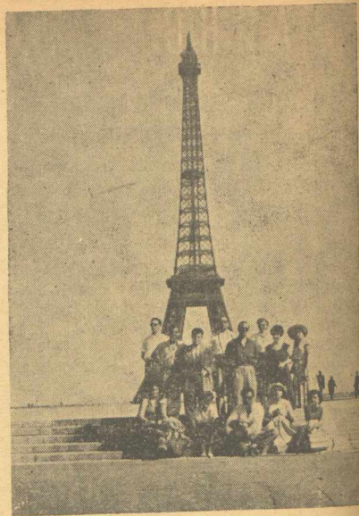
Οἱ «Νομικοὶ» στὴ σκιά τοῦ «Αἴφελ»

Μετὰ τὴν ἐπιπλέον ἐντυπώσεις καὶ τὴν εὐχὴν νὰ πραγματοποιηθῶναι καὶ ἄλλες ἐκδρομὲς ἐπέστρεψαν οἱ συνάδελφοι τῆς Νομικῆς ἀπὸ τὸ ἀξέχαστο ταξεῖδι τους.