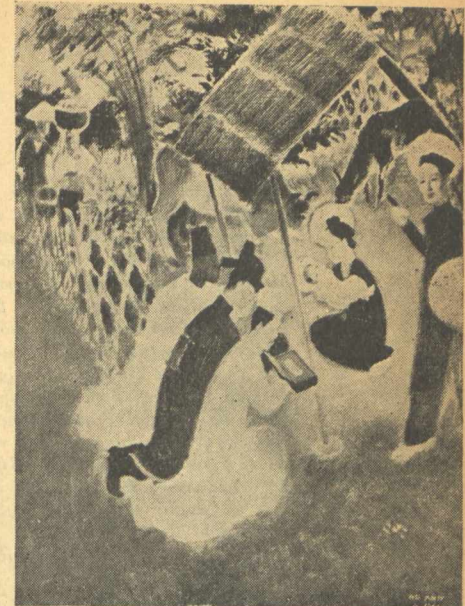
«Τό προσκύνημα τῶν Μάγων», μέ τροπικό φόντο, ἀπό Βιετναμίτη καλλιτέχνη.

Πολιτισμό! Κάθ' ἕνας νά κυτιάξῃ Τό Μέλλον! Τούς Ἐφῆστιους Θεούς μας Νοιασιῆτε πρῶτα, χίτιτε τούς Ναούς μας. ΓΙΑΝΝΗΣ ΞΕΠΟΥΛΙΑΣ