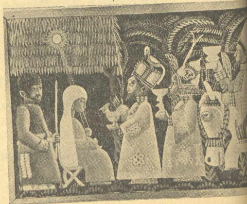
«Το προσκύνημα των Μάγων», εξαιρετικά λεπτοεργημένος πίνακας από την Νιγηρία.

«Ο Χριστός στη Φάτνη» Ιαπωνία, σελ. 185.