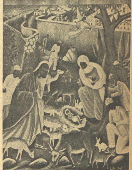
ἘἩ Γέννηση» τοῦ Καστέρα Μπαζίλε, γνωστοῦ καλλιτέχνη τῆς Ἀιτίας.