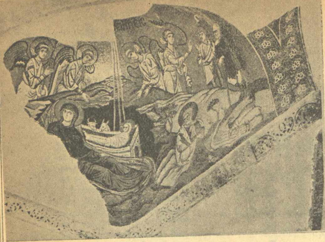
«Η «Γέννηση του Χριστού», μωσαϊκό του Που αλώνος, όπως το βλέπει κανείς στην Εκκλησία του Δαφνίου, κοντά στην Αθήνα.