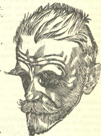
Στις 27 Φεβρουαρίου 1943 πέθανε ο μεγάλος μας ποιητής Κωστής Παλαμάς. Τιμώντας τήν μνήμη του, δημοσιεύουμε τούς «Πατέρες» από τούς «Βομούς».

Παιδί, τό περιβόλι μου πού θά κληρονομήσεις, όπως τό βρείς κι όπως τό δεις νά μην τό παρατήσεις. Σκάψε το ακόμα πιό βαθιά και φράξε το πιό στέρεα, και πλούτισε τή γλώση του και πλάτυνε τή γή του, κι ακλάδευτο διον μπλέκεται νά τό βεργολογήσεις, και νά του φέρονε τό νερό τό άγνό τής βουσομάνας, κι αν αγαπάς τ’ ανθρωπινά κι σα άρρωστα δέν είναι, ρίξε άγιασμό και ξόρκισε τά ξωτικά, νά φύγουν, και τή ζωνιάνια σπείρε του μ’ σα γερά, δροσάτα. Γίνε όργοτόμος, φιντεντής, διαφεντεντής. Κι αν είναι κι έρθουν χρόνια δίσεχτα, πέσουν καιροί όργοτόμοι, κι σα πουλιά, μισέφρονε οικιασμένα, κι σα δέντρο, για τίποτ’ άλλο δέ φελάν παρά για μετερίζια, μη φοβηθείς τό χαιλασμό. Φωνιά! Τσεκούρι! Τράβα, έσπέρμεψέ το, χέρσωσε τό περιβόλι, κόφτο, και χτίσε κάστορο άπάνον του και ταμπορώσου μέσα, για πάλεμα, για μάτωμα, για τήν καινούρια γένα, π’ όλο τήν περιμένουμε κι όλο κινάει για νάρθει, κι όλο συντριμύ χάνεται στο γύροσμα τών κύκλων. Φιάνει μιá ιδέα νά στο πει, μιá ιδέα νά στο προστάξει, κορώνα ιδέα, ιδέα σπαθί, πού θά ειπ’ άπάνον απ’ όλα.