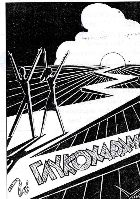
- Το τρίτο τεύχος, 1 Δεκεμβρίου 1943.