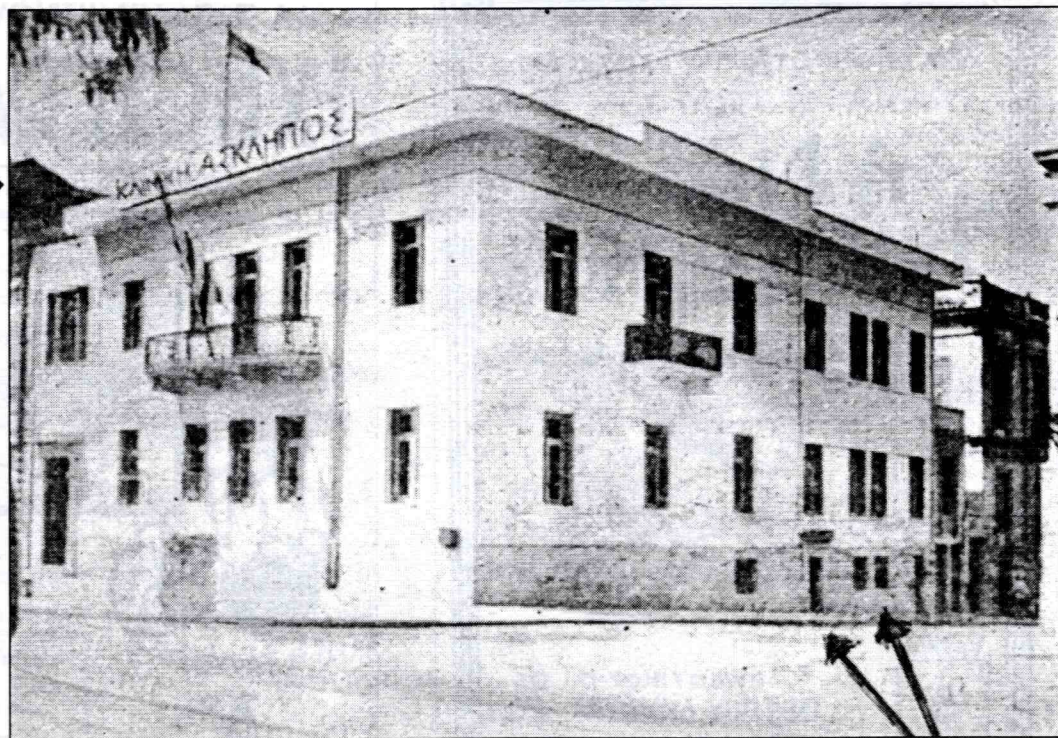
- Η είσοδος και τα παράθυρα των γραφείων του περιοδικού επί της οδού Μπουμπουλίνας 20α.