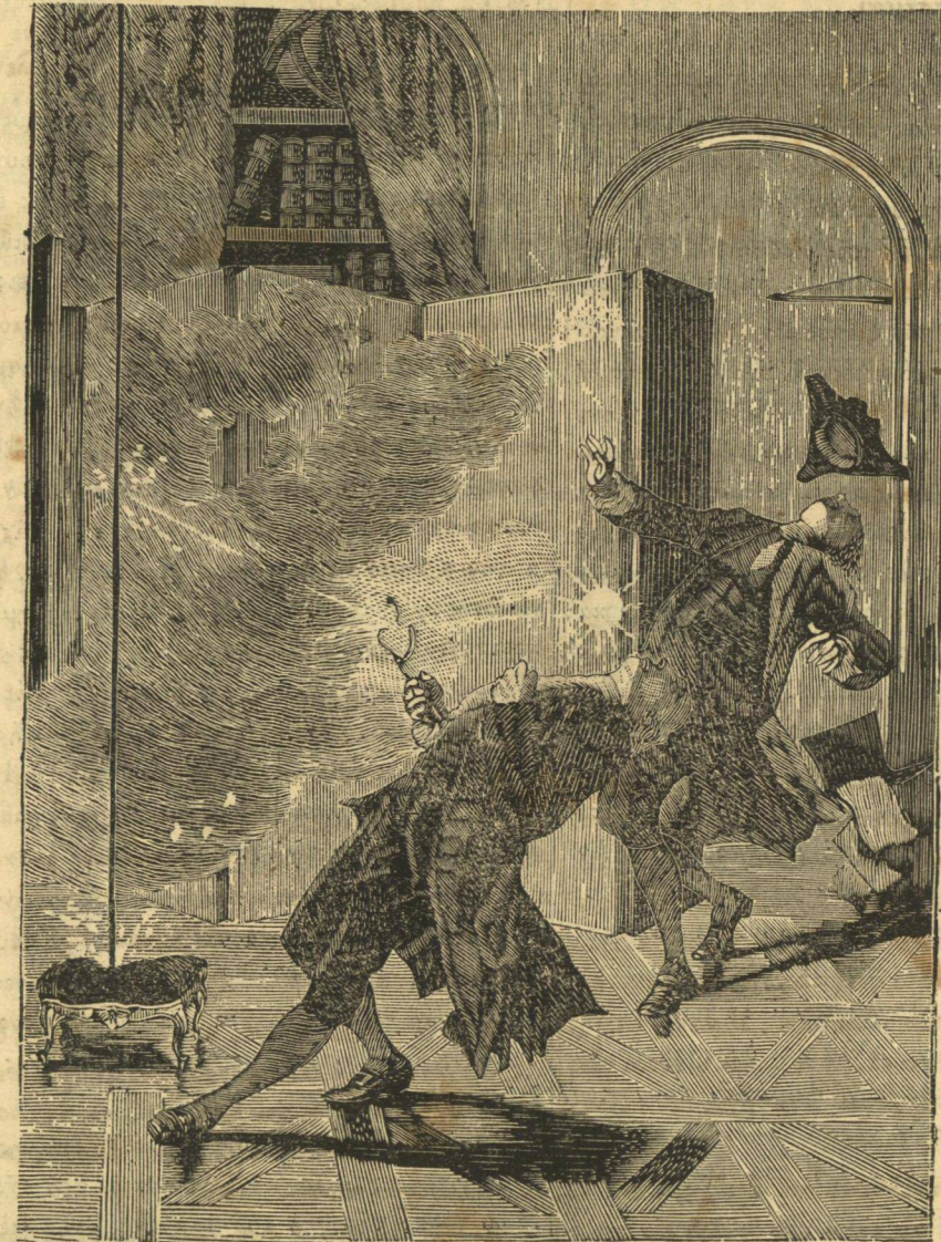
(Σχ. 2) Ὁ κεραυνοβόλος θάνατος τοῦ Ριχμάνου. (σελ 104).

Οὔτω καὶ ἐν τῷ Ἰωάννη ἐμελλε νὰ γεννηθῇ ὁ ἀρίστος πόθος πρὸς τὸ χειρίζεσθαι τὰ χρώματα, ἐπειδὴ κατὰ δύο ὅλα ἔτη καὶ ζωγραφίας ἐβλεπε καὶ ἐνόδων ἦκουεν ἀνδρῶν, μέχρις ἄστρον ἀνυφούντων τὴν ζωγραφικὴν τέχνην. Ὅθεν, θέλων νὰ ἠδύνη τὰς μακρὰς τῆς μονώσεως ὥρας, καθ' ἃς ἀνέμενε τοῦ κυρίου του τὴν ἐπάνοδον, ἐπειράτο νὰ ζωγραφῇ. Εἶχε δὲ μόνα ζωγραφικὰ ὄργανα ὄσους ἐνθεν κἀκεῖθεν συνέλεγε τετριμμένους χρωστήρας καὶ χρωμάτων ἀχρηστα λείψανα, διὸ καὶ