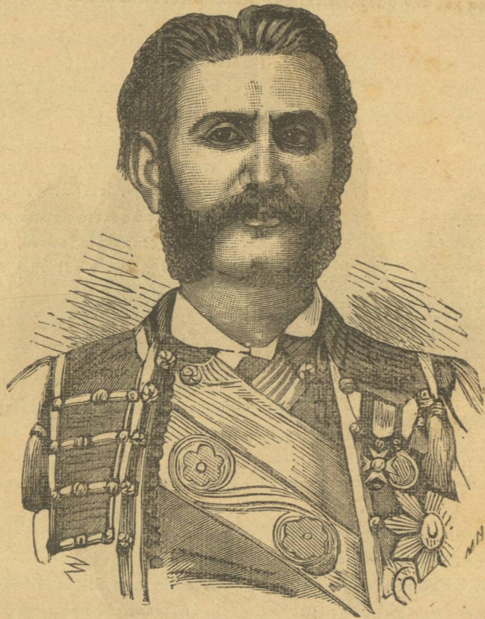
ΝΙΚΟΛΑΟΣ ΠΕΤΡΟΒΙΤΣ (Ἡγεμὼν τοῦ Μαυροβουνίου).

μετέρας μεγαλοπόλεως κόσμῳ ἀπολαύει ὑπόληψως· τοιοῦτος ὁ ἀξιοπρεπῆς οὗτος ὁμογενῆς πρὸς ὃν οὕτως ζωηρὰν ἢ Αὐτοκρατορικὴ Κυβέρνησις τρέφει ὑπόληψιν, τοιοῦτος τέλος ὁ ΙΩΑΝΝΗΣ ΕΦΕΝΔΗΣ ΣΙΣΜΑΝΟΓΛΟΥΣ.