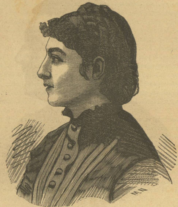
ΝΑΘΑΛΙΑ (Ἡγεμονίς τῆς Σερβίας).