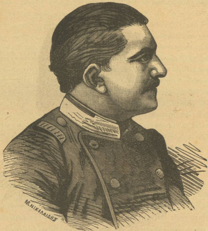
ΜΙΛΑΝ (Ἡγεμὼν τῆς Σερβίας).

Μεταμόρφωσις αἰωνία τῶν κόσμων καὶ τῶν ὄντων!! Ποσάκις ἡ ἐπιφάνεια τῆς Γῆς δὲν ἀνε-