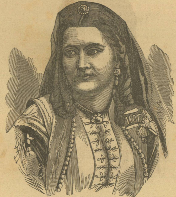
ΜΑΡΙΑ ΠΕΤΡΟΒΝΑ (Ἡγεμονίς τοῦ Μαυροβουνίου).

ἐκείνην μεγαλοφυΐαν, ἐν σμικρῷ διαστήματι χρόνου εἰς τοιαύτην ἀνήλθεν ἐπιζηλον δόξαν, ὥστε ἀδιαφόρως ἐθεώρει παρὰ τὸ κλειδοκύμβαλον αὐτοῦ τὸν αὐτοκράτορα Φραγκίσκον ἐκ θαυμασμοῦ σπαίροντα, τὴν δὲ μεγάλην ἀνασσαν Μαρίαν Θερισίαν στρέφουσαν τῶν τετραδίων του τὰς σελίδας. . . . Ὁ μόνος τῶν θνητῶν ὅστις αὐτοκράτειρας ἐδέξατο ἀσπατμόν, ὁ μόνος ὅστις ἐν τῇ