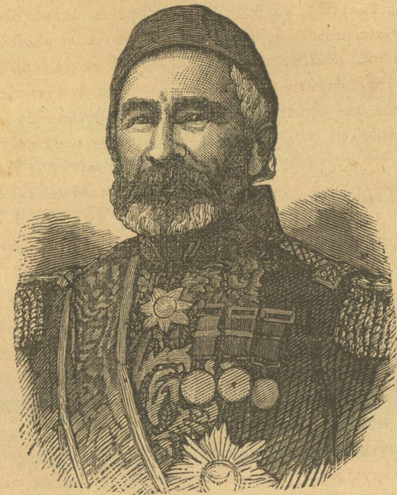
ΔΕΡΒΙΣ ΠΑΣΣΑΣ (Γενικὸς διοικητὴς Σκῶδρας).

Ἄλλὰ δυστυχῶς ἡ θέσις αὐτῆς δὲν διετηρήθη καὶ εἰς τὰς κατόπιν ἐποχὰς, ἡ μετὰ τῶν Ἀσιανῶν σύγχρωσις ἐπέφερε σπουδαίαν μεταβολὴν εἰς τὰ ἦθη αὐτῶν. Ἐπελάθοντο τῆς χαριέσεως καὶ πλήρους εὐδαιμονίας ἀφελοῦς οἰκογενειακῆς