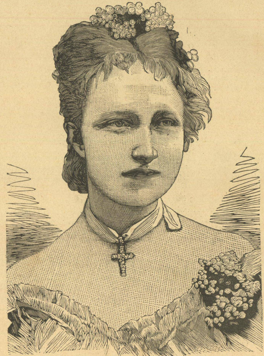
Η ΠΡΙΓΓΗΒΕΣΣΑ ΣΤΕΦΑΝΙΑ, ΣΥΖΥΓΟΣ ΤΟΥ ΔΙΑΔΟΧΟΥ ΤΗΣ ΑΥΣΤΡΙΑΣ.

ὁ Λεσπινασοῦ . . . ἔχεις τὴν ἀγριότητα ἀλλὰ συ- νάμα καὶ τὴν ἀνανδρίαν τοῦ λύκου . . . μόνον μακρόθεν γνωρίζεις νὰ φονεύης . . . πλησίασόν