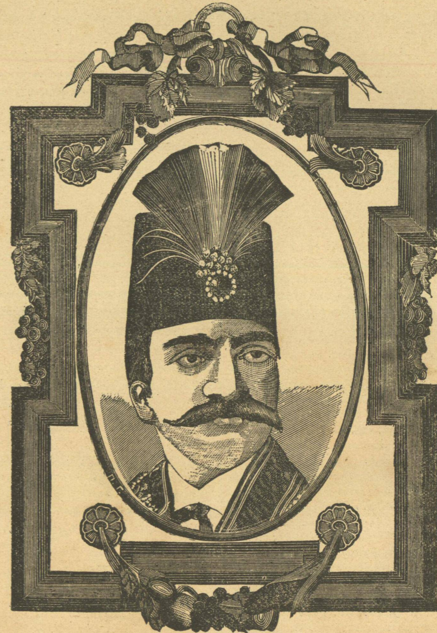
Η Α. Μ. ΝΑΣΡ-ΕΔΔΙΝ-ΣΑΧ (ΒΑΣΙΛΕΥΣ ΤΗΣ ΠΕΡΣΙΑΣ).

γράδ σχεδὸν εἰς διάστημα ἑκατὸν βερστίων, διὰ κλήσια τῆς Ἀγίας Σοφίας ἐκτισμένη κατὰ τὸ σχέδιον τῆς ἐν Κωνστ]πόλει, ἀνάκτορα, κτλ. Ἡ