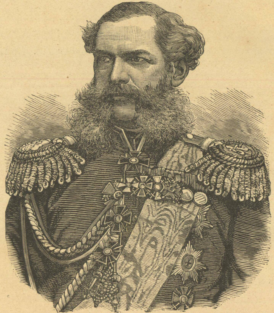
Ο ΠΡΙΓΚΗΨ ΔΟΝΔΟΥΚΩΦ ΓΟΡΓΖΑΚΩΦ.

ἡ κόμησσα, ἀλλ' ἐπειδὴ εἶμαι φύσει δεισιδαίμων, ἔκρινα νὰ κάμω καὶ ἐγὼ ὡς οἱ λοιποὶ καὶ νὰ ἀναμένω τὴν διάβασιν τοῦ βροουκόλακος, ἂν ἐ- μελλον νὰ στερηθῶ τοῦ δείπνου, εἰς ὃ ἤμην προσκεκλημένη. Ἐπειδὴ δείπνον μὲν εὐρίσκει τις ὅσα- κις θέλει, ἀλλ' οὐχὶ καὶ βροουκόλακος. Ἄλλως τε