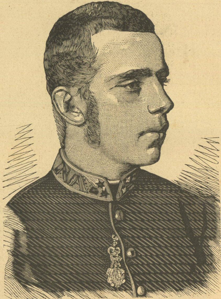
Ο ΑΡΧΙΔΟΥΞ ΡΟΔΟΛΦΟΣ ΔΙΑΔΟΧΟΣ ΤΗΣ ΑΥΣΤΡΙΑΣ.

παράθυρον ὅπως μὴ διατρέχει τὸν κίνδυνον τοῦ να προσβληθῆ ὀπισθεν συγχρόνως δὲ ἐμπόδιζε καὶ τὴν ὀπισθοχώρησιν τῶν Γρίζων οὔτινες κλεί- οντες τὴν θύραν εἶχον σύρει καὶ τὸν μοχλὸν, καὶ δὲν ἠδύναντο δὲ νὰ τὴν ἀνοίξωσιν ὡς εὕρισκο- μένην ἐντὸς τῆς ἀκτίνος τοῦ σπινθηροβόλου κύ-