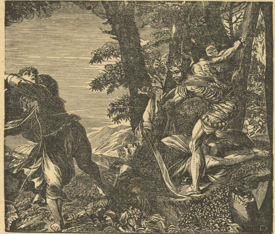
ΤΟ ΜΑΡΤΥΡΙΟΝ ΤΟΥ ΑΓΙΟΥ ΠΕΤΡΟΥ.

Τὸ λέγειν ἄρα ὅτι τὸ τυφλὸν αὐτόματον, ἦτοι δύναμις ἄνευ, ἄλογος καὶ ἀσυνείδητος ἐδημιούργησε καὶ διακυβερνᾷ λογικώτατα καὶ σκοπιμώτατα τὸ θαυμάσιον καὶ παναρμόνιον Σύμπαν, ἔστιν ἡ παραλογώτερα τῶν ἀντιφάσεων, (πολλῶ παραλογώτερα τοῦ λέγειν δύο καὶ δύο ποιοῦσι πέντε), ἦν ὁ ὀρθὸς λόγος ἀποδιοπομπεῖται καὶ ἦν μόνον ἄ-