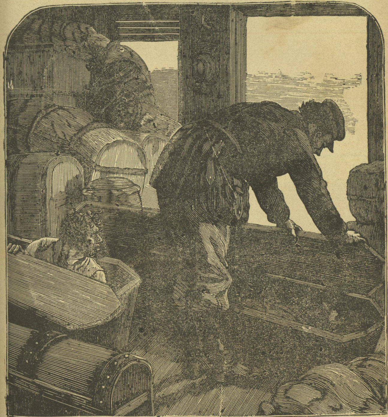
Ὁ ὑπάλληλος ἀποκαλύπτει τὰ νεκροκράββατα καὶ ἀνακαλύπτει τὴν δολοπλοκίαν τῶν ληττῶν.

Τότε συνειπέρανον τὰ πάντα. Ἡβελιν πέσει θῶμα οἰκτρᾶς συνωμοσίας. Οὕτω ἦσαν σύμφωνοι νὰ μὲ δολοφονήσωσι καὶ ἀρπάσωσι τὴν ἑκατὸν χιλιάδας χρυσᾶ δολλάρια. Ὁ ἄνθρωπος μὲ τὸν ὑάλινον ὄφθαλμόν, δὲν ὑπῆρχεν οὐδεμία ὑπόψια: ὅτι ἔζη, ἀναμφιβόλως δὲ καὶ ὁ σύντροφός του. Ἄμέσως σκέπτομαι ὅτι ὁ ὁδηγὸς τῆς κηδείας ταύτης δὲν εὐρίσκειτο μακρὰν κατορθώσας ἐπὶ πλέον νὰ βεβαιωθῶ καὶ περὶ τῆς κανονικῆς ἀνα-