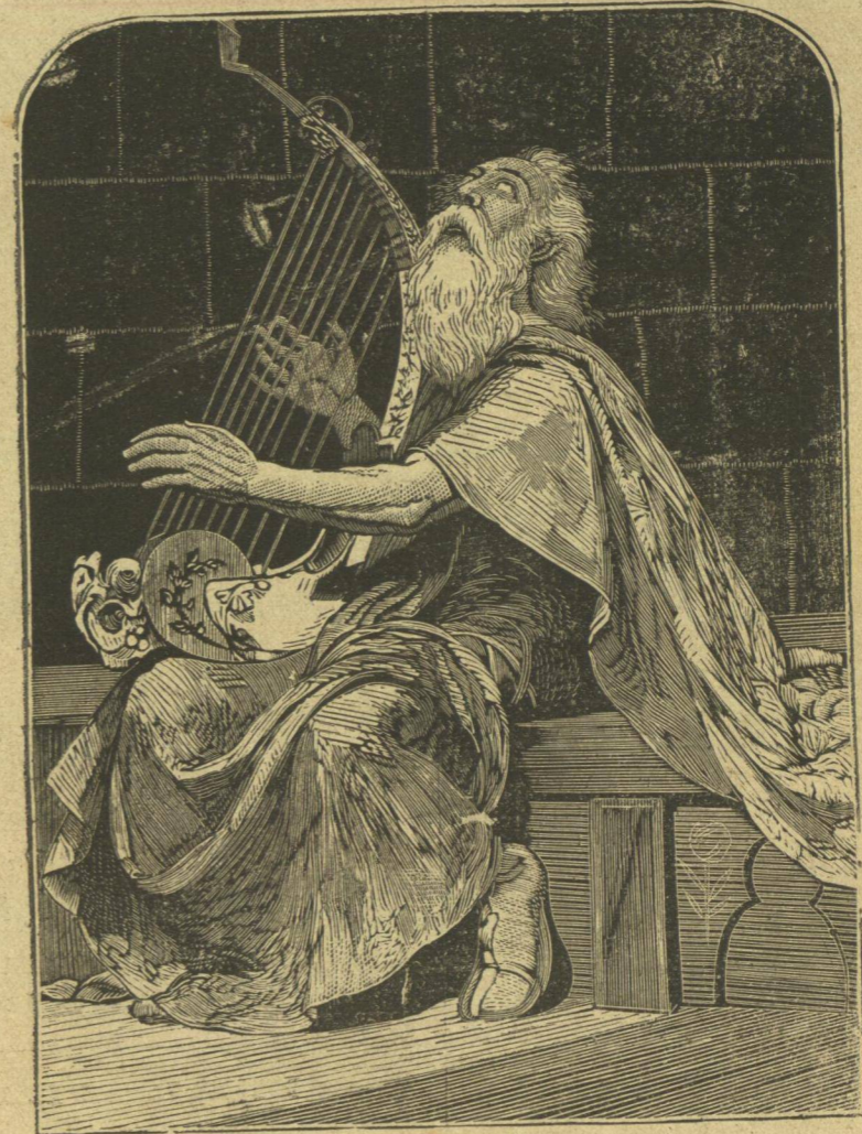
Ὁ Ὀσσιανὸς κρούων τὴν ἄρπαν.

την ὁμως· διότι ἡ εἰκὼν αὕτη ἐτέθη ἐνταῦθα οὐχὶ διὰ νὰ συντελεθῇ αὕτη καὶ μακρὰ, ἴσως ξηρὰ καὶ ἀδιέφορος διὰ τοὺς πολλοὺς, φιλολογικὴ μελέτη. ἀλλ' ἀπλῶς διὰ νὰ δοθῇ νύξις τις τῷ ἀναγνώστῃ πρὸς μελέτην καὶ ἐρευναν, ἐὰν θέλῃ, τῶν κατὰ τὸν Ὀσσιανόν. Οὐχ ἦτον ὁμως ἐπιφερόμεν ἐλί- γας τινὰς λέξεις περὶ τοῦ μυστηριώδους τῆς Σκω-