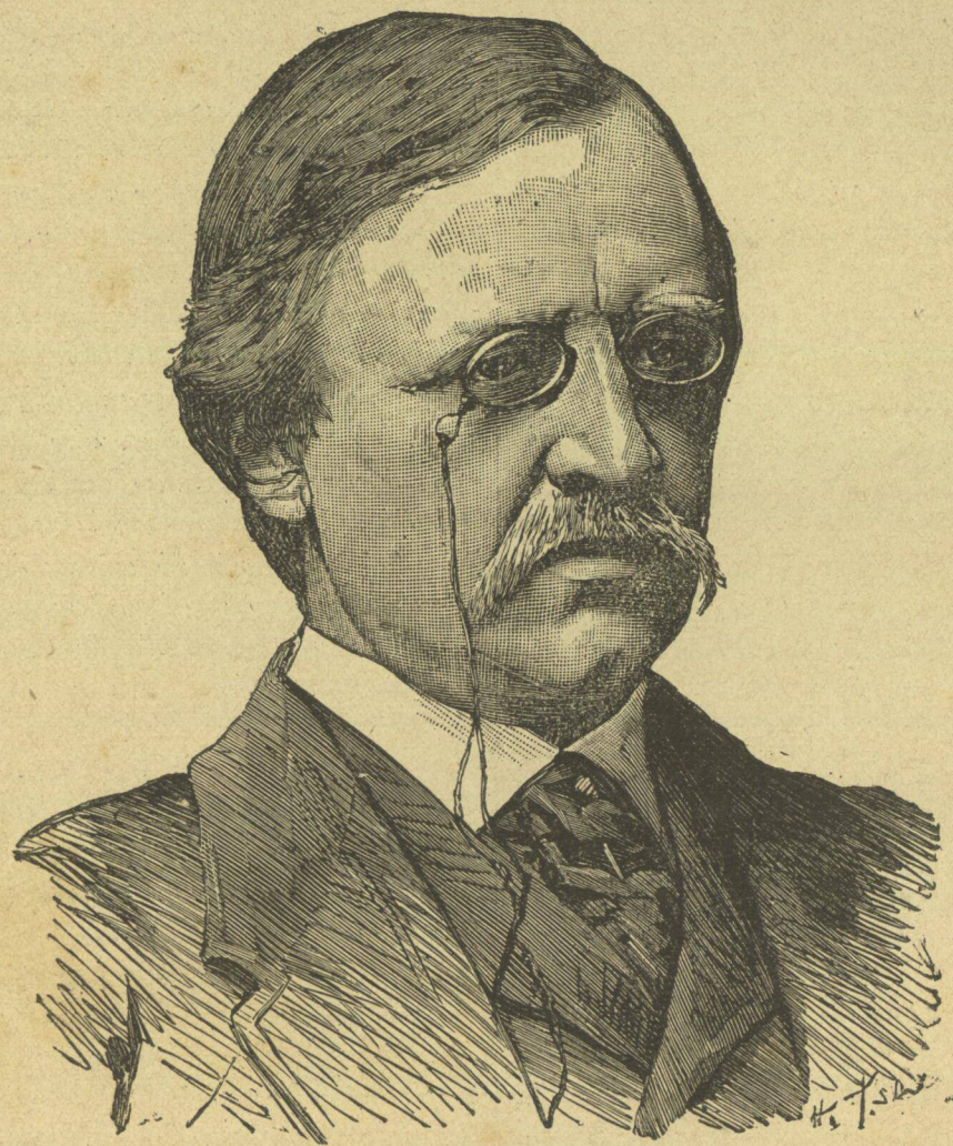
Ὁ Καθηγητὴς Νορδένσκιολδ.

Κατὰ Ἰούλιον τοῦ 1878 δύο πλοῖα ἡ Βέγα καὶ ἡ Λένα ἀπέπλευσαν ἐκ Σουηδίας διευθυνόμενα βορειανατολικῶς πρὸς διάνοξιν διαβάσεως. Ὁ τὴν ἐκδρομὴν ἄγων καθηγητὴς Νορδένσκιολδ πεπεισμένος ἦν περὶ τοῦ δυνατοῦ τῆς διὰ τῆς ὁδοῦ ταύτης ἀποκαταστάσεως ἐμπερικῶν σχέσεων