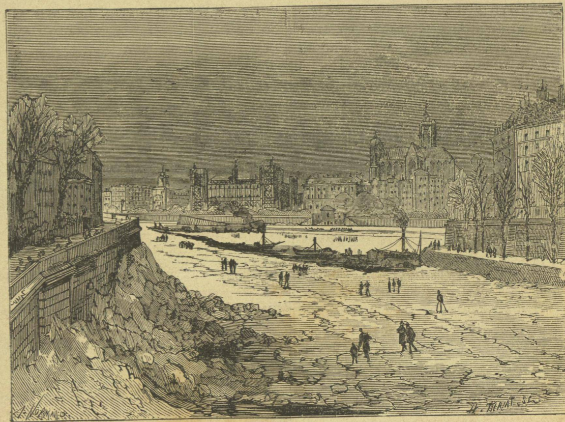
Ἡ Παναγία τῶν Παρισίων ἐπὶ τοῦ Σηκουάνα ποταμοῦ

Πολὺ ὠραῖα λέγομεν καὶ ἡμεῖς διὰ τοὺς ὠραίους τούτους συλλογισμοὺς, διότι κατὰ τὴν κυ-