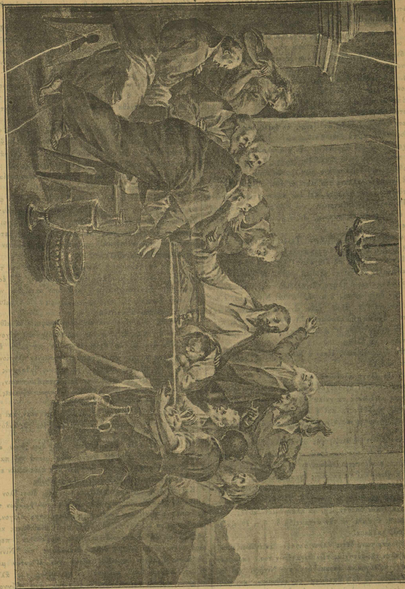
Ο ΜΥΣΤΙΚΟΣ ΔΕΙΓΜΟΣ

Ἄλλ' ἐν καθαρᾷ μεσημβρίῳ νὰ προσβάλλῃ καὶ λεηλατήσῃ κατοικοῦμενον τόπον, τὴν ἐπαυλιν ἑνὸς τῶν πρωτίστων ἀρισ- τοκρατῶν, νὰ δεσμεύσῃ τὴν οἰκογένειαν καὶ τοὺς ὑπηρέτας αὐτοῦ, καὶ ν' ἀπαγάγῃ αἰχμάλωτον δημόσιον ἀξιωματικόν,