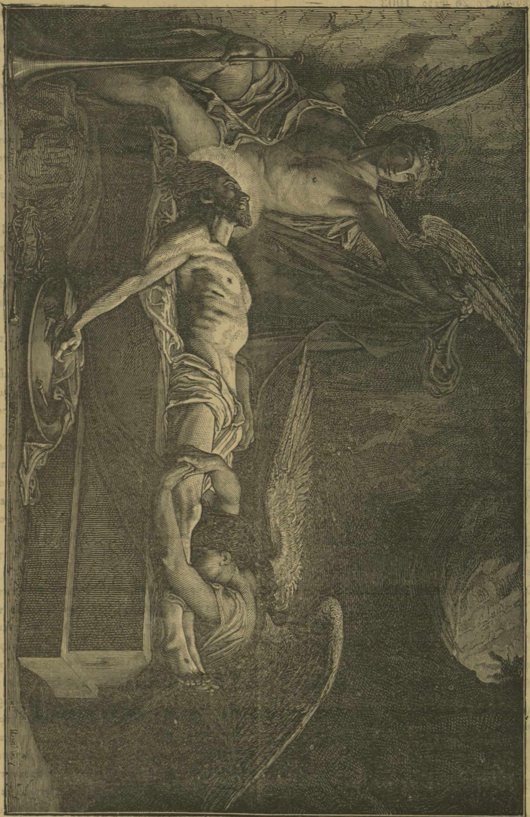
Ο ΧΡΙΣΤΟΣ ΕΝ ΤΑΦΩ