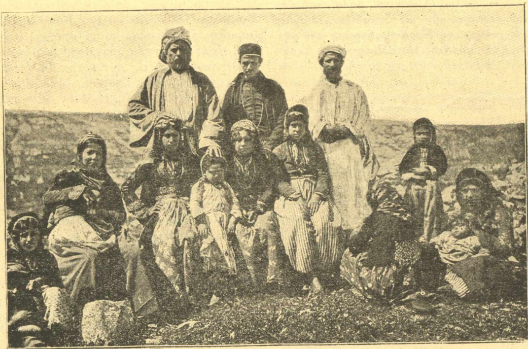
Φωτογραφία συγχρόνων Σαμαρειτών ζώντων εις Ναβλούς.

νισθείσης διαστάσεως μεταξύ Σαμαρειτών και Ιουδαίων.