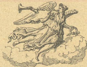
ΔΙΕΥΘΥΝΤΗΣ ΚΑΙ ΕΚΔΟΤΗΣ