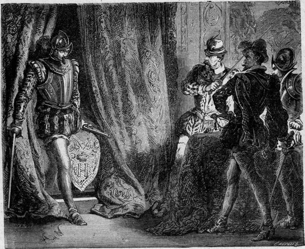
Ἀφνης ἡ ὀπλισμένη μορφή ἠγέρθη καὶ ἐπροχώρησεν ἐν βῆμα. [Σελ. 164]

ΕΤΗΣΙΑ ΣΥΝΔΡΟΜΗ Ἐν Ἀθήναις: δρ. 5, ταῖς ἡμέραις 6, τῷ ἰσχυροτέρῳ 10 ΦΥΛΑΑ προηγουμένα λιπτά 20. Ἀποσυνδραμαί ἀποστέλλονται ἀπ' εὐθείας εἰς Ἀθήνας διὰ γραμματοστέμου καὶ χαρτονομισμάτων παντὸς ἔθνους.