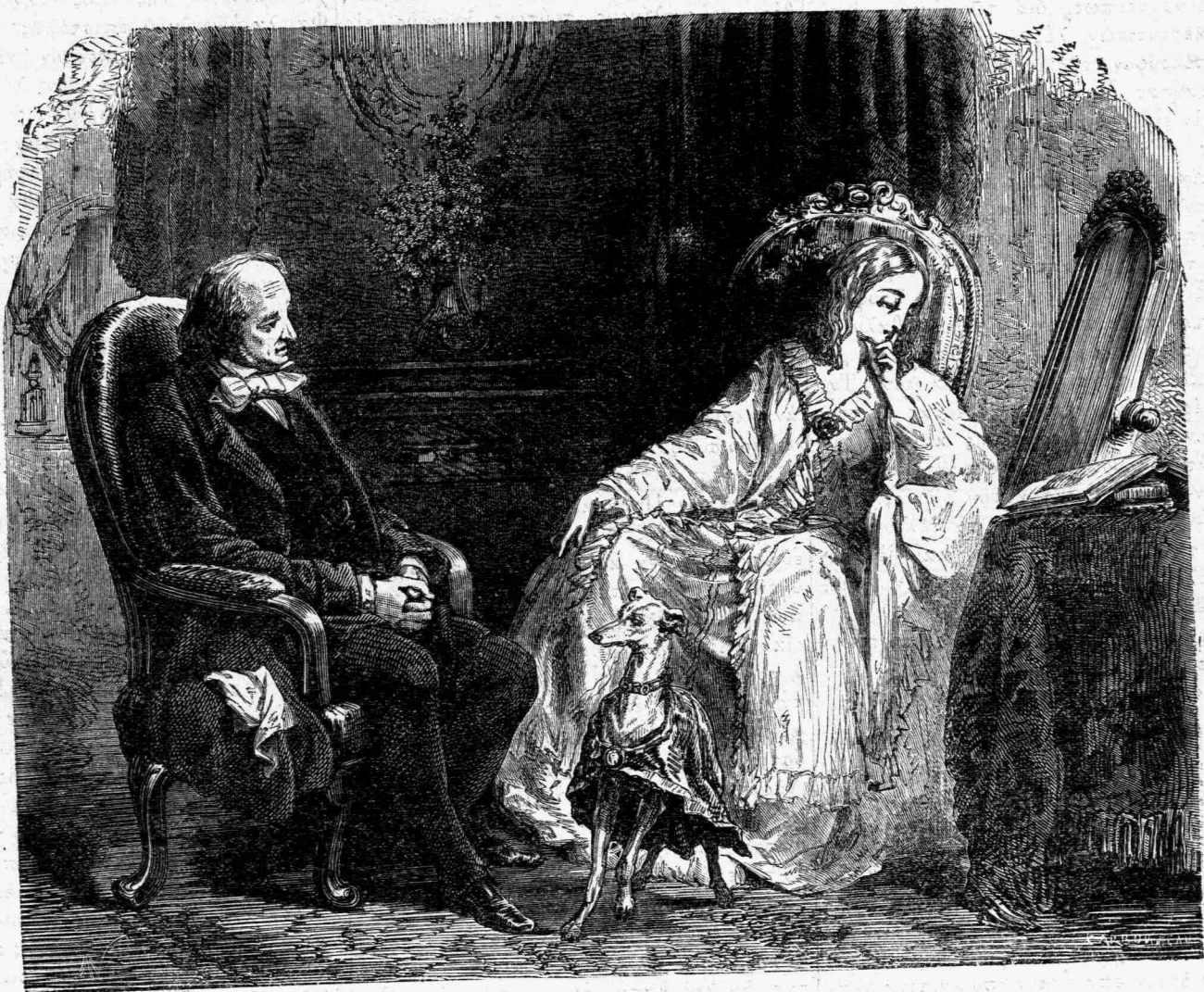
Με παρατήρησεν ἐπὶ στιγμὴν καὶ εἶτα ἀπέστρεψε τὴν κεφαλὴν. (Σελ. 392)

ΕΤΗΣΙΑ ΣΥΝΔΡΟΜΗ Προπληρωτέα Ἐν Ἀθήναις: δρ. 5, ταξ. Ἰπασχίαις 6, τῶν ἑξωτερικῶν 10 ΦΥΛΑΑ προηγουμένα λεπτὰ 20. Αἱ συνδρομαὶ ἀποστέλλονται ἀπ' Ἰθάκης εἰς Ἀθήνας διὰ γραμματοσήμεου καὶ χαρτονομισμάτων