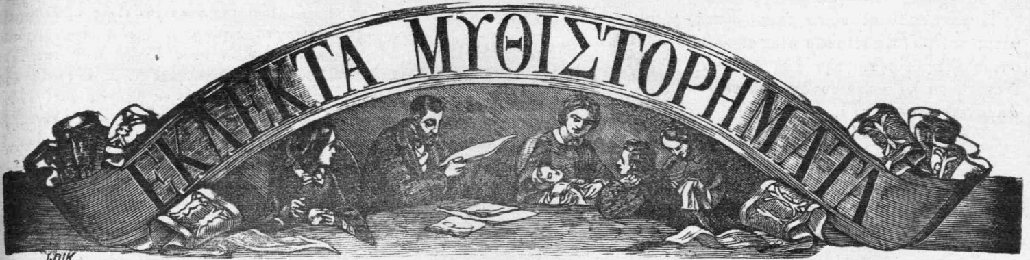
ΕΙΚΟΝΟΓΡΑΦΗΜΕΝΟΝ ΠΕΡΙΟΔΙΚΟΝ ΕΚΔΙΔΟΜΕΝΟΝ ΚΑΤΑ ΚΥΡΙΑΚΗΝ ΚΑΙ ΠΕΜΠΤΗΝ