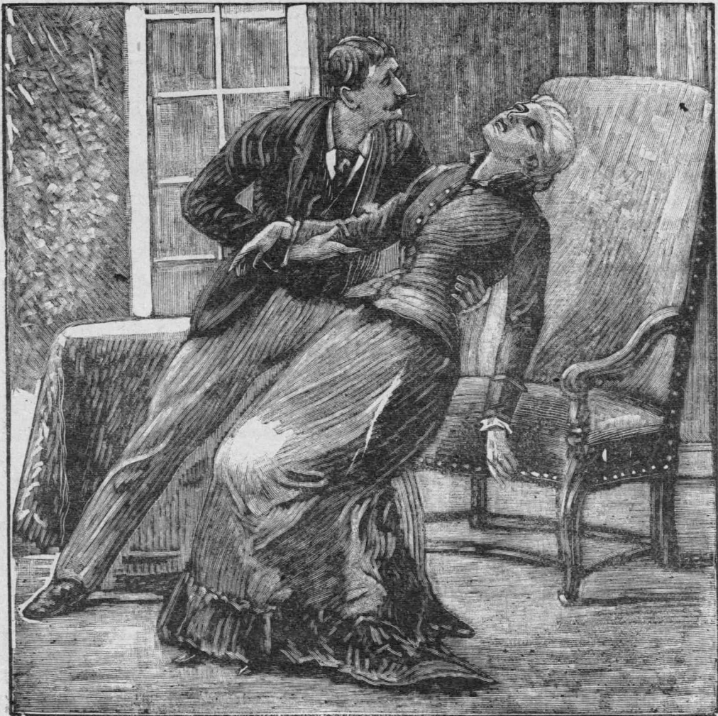
Ὁ Γεράρδος κατετρόμαξε πρὸς στιγμήν. (Σελὶς 204).