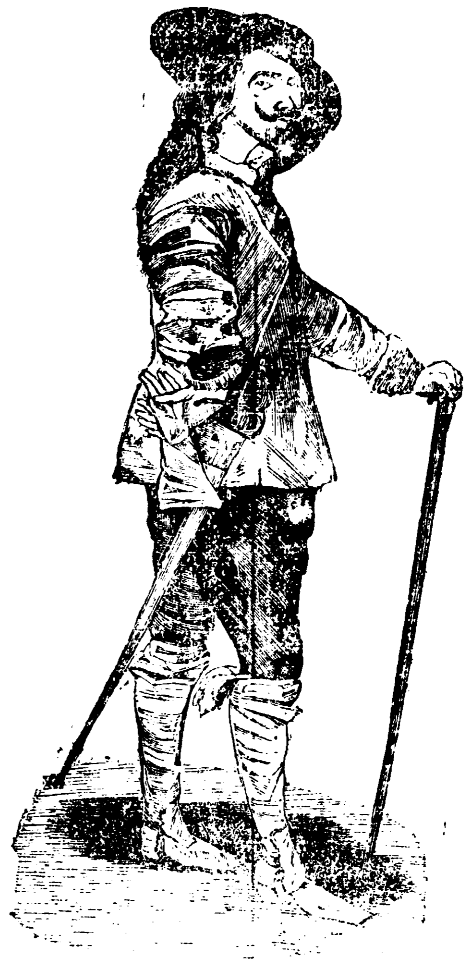
ΚΑΡΟΛΟΣ Α΄, Βασιλεὺς τῆς Ἀγγλίας.

γράφος ἐνεπλήσθη τιμῶν καὶ φιλοδωριῶν. Ὁ βασιλεὺς τὸν κατέστησεν ἱππότην, τῷ ἔδωκε χρυσῆν ἄλυσον μεγάλου βάρους μετὰ τοῦ ἀδαμαντοκολλητοῦ εἰκονίου του. Ἡ βασιλικὴ αὐτῆ εὐνοία ἐθέρμανεν ἐκ νέου τὴν πρὸς τὴν ζωγραφικὴν ζέσιν τοῦ Βὰν Δύκ. Ἦρχισε νὰ ἐργάζεται μετὰ τοσαύτης ἐπιμονῆς, ὥστε ἐγέμισε τὰς ἐκκλησίας καὶ τὰ ἀνάκτορα μὲ τὰς εἰκόνας του, αἵτινες ἐπέσυρον τὸν παγκόσμιον θαυμασμόν.