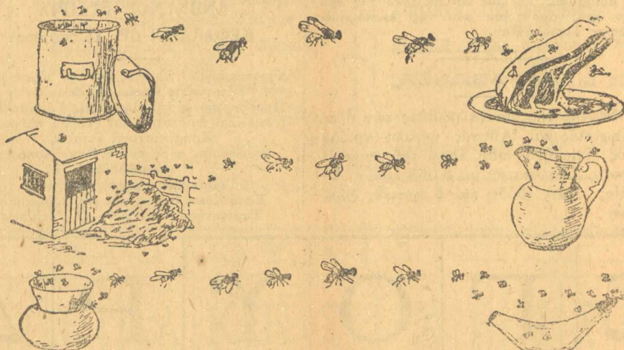
Τα έρεϊνα τής Αμαλιάδος, τής όποιας κατέρρευσαν όλα αι οικίαι συνεπεία βροχών.