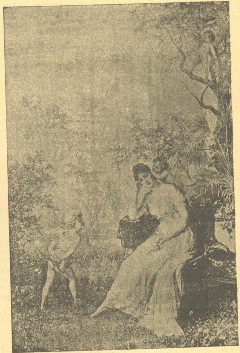
Ε Ρ Ω Σ Κ Α Ι Φ Υ Σ Ι Σ