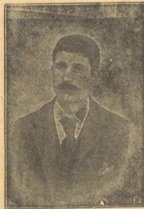
Ἔχει ὁ Πλούταρχος γλυκὰ πάντοτ' ἐξαιρετικὰ

Τὸν Σαλούτσην τῆν Ζακύνθου εὐχαριστῶς χαιρετῶν, γιὰ τ' ὄρατο ποίημά του μετὰ τῶν ἀναγνωστῶν, τ' ἀποστέλλω τοὺς ἐπαίνους κι' ἄλλα λόγια ἡγαρδίακᾶ διὰ τῆς παρούσης στήλης νὰ τὰ λάβῃ ἀδελφικά.