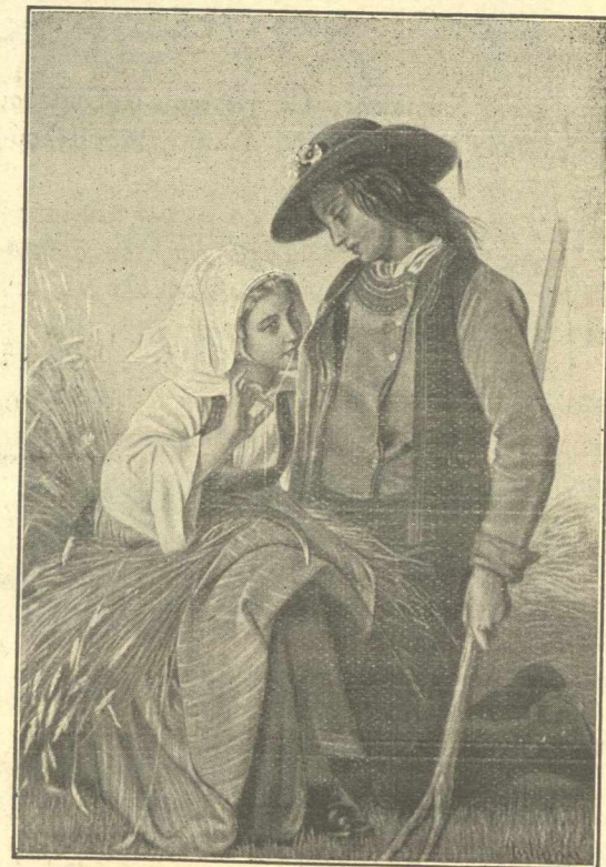
Εἰδυῖλλον τῶν ἀγρῶν.

— Ἄλλὰ καὶ τοῦτο εἶνε συγγενὲς πρὸς τὸν ἔ- ρωτα, ὦ Μυρτάλη, διότι ἡ καρδία τοῦ ἀνθρώπου, ὅταν οὗτος δὲν αἰσθάνεται ἔρωτα, εἶνε βαθυτέρα τῆς ἀβύσσου, σκληροτέρα τοῦ βράχου καὶ πυκνο- τέρα τοῦ σιδήρου. Μὴ ζητῆς λοιπὸν τὸ ἀδύνατον. Βραχὺς καὶ πολὺτιμος εἶνε ὁ χρόνος τῆς εὐτυχίας, τὸν ὁποῖον μᾶς ἔδωκαν οἱ Θεοί, καὶ ἂν ἀγαπᾷς