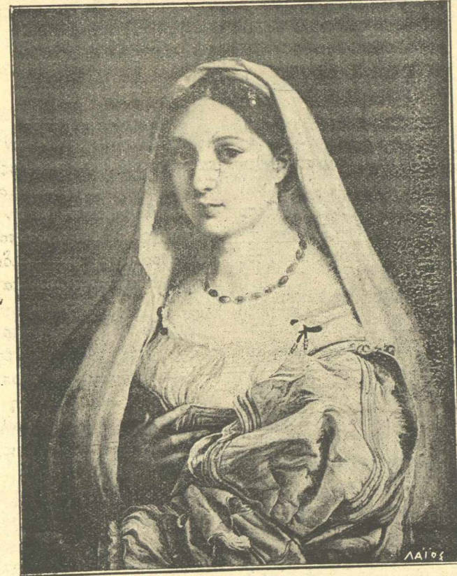
Ἡ πεπλοφόρος (Ἔργον τοῦ Ραφαήλ.)

Οὕτω δέ, καθὼς ἦτο ἐπόμενον, ἡ συρροὴ τῶν