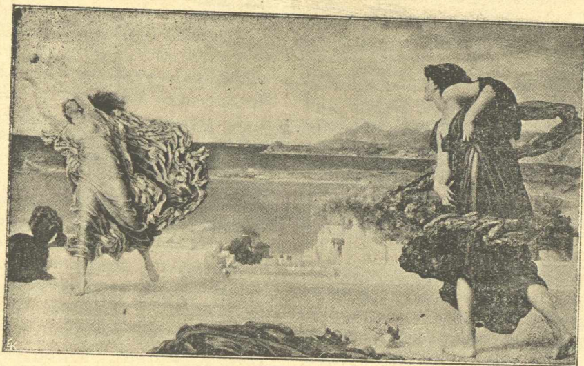
Η παιδιά της θάλασσας παρ' αρχαίους.

βανεν ως σύζυγον θά τῷ ἐφείρετο πάντοτε με τὴν ὑπεροχὴν γυναικὸς ἣτις ἐγνώριζεν εἰς ἡλικίαν ἐπτὰ ἐτῶν νὰ παίζη τὴν ὀμβρέλλαν, ἐνῶ ἐκεῖνος εἰς αὐτὴν τὴν ἡλικίαν δὲν ἐγνώριζεν ἀκόμη εἰ μὴ νὰ σχίζη τὰς περισκελίδας του.