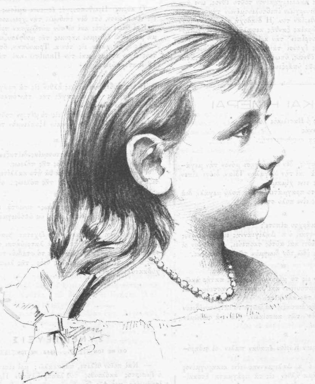
Ἡ Πριγκίπισσα WILHELMINE τῶν Κάτω Χωρῶν