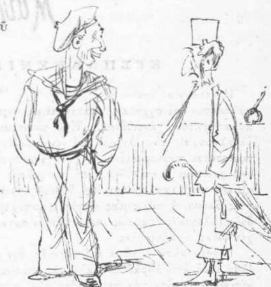
— Μίαν ἑλλειψὴν πορετήρησα εἰς ταῖς Σπέτζαις. — Ποίαν ; — Ὅτι δὲν ἔχουν παππᾶ.