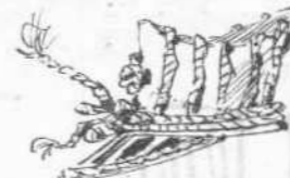
Τὰ νέα καπέλα τοῦ στρατοῦ