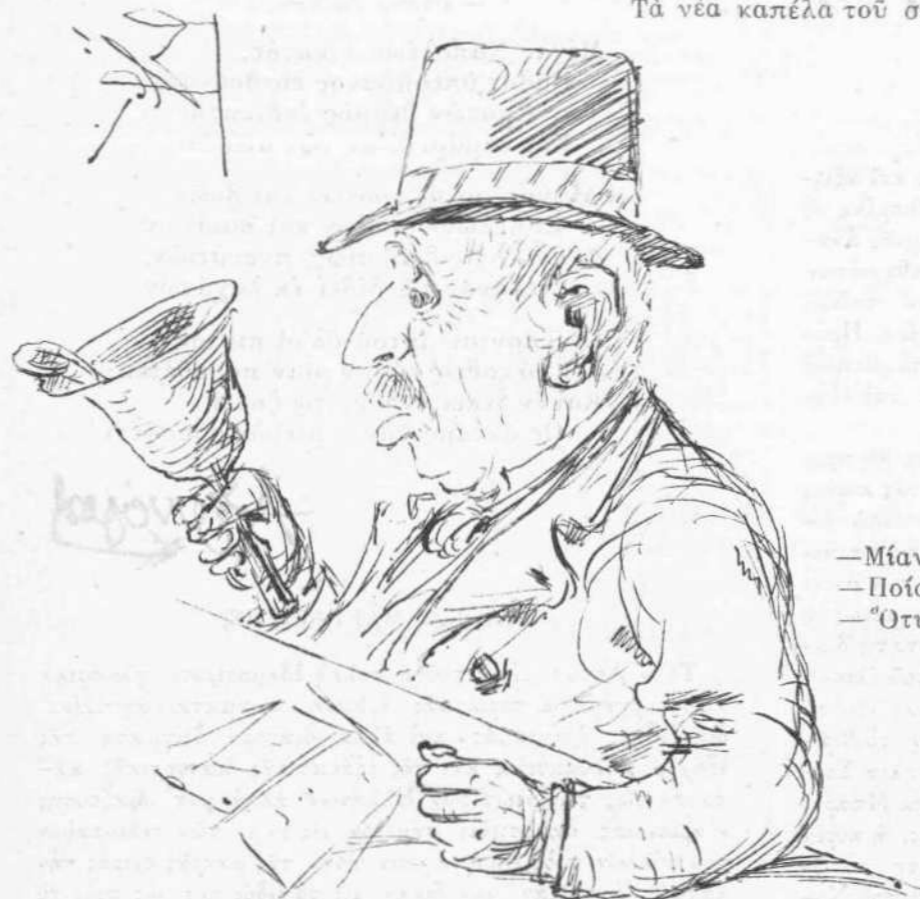
Ὁ προσωρινὸς Πρόεδρος τῆς Βουλῆς.