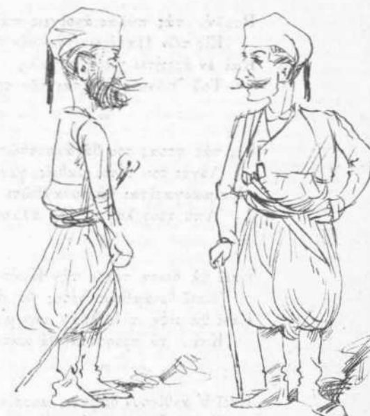
— Ἀλήθεια μᾶς ἔκοψε τὸ σιτηρέσιον ; — Θὰ τοῦ τὸ εἶπε φαίτεται ἡ Εὐρώπη.