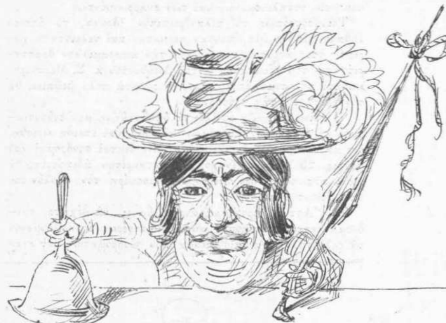
Ὁ προπροσωρινὸς Πρόεδρος τῆς Βουλῆς.