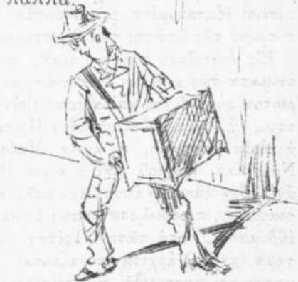
Διὰ τὴν ἀφίξιν τοῦ κ. Βαλσαμάκη.