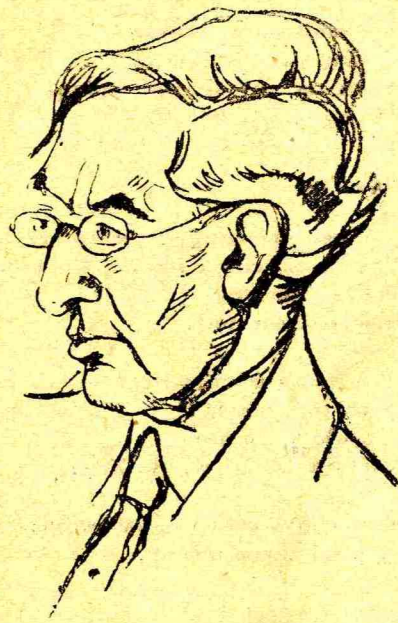
Κ. Π. ΚΑΒΑΦΗΣ