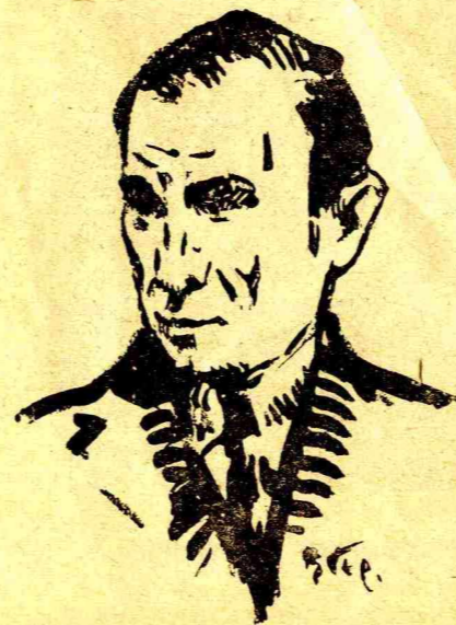
Ο ΖΩΓΡΑΦΟΣ ΜΙΧ. ΟΙΚΟΝΟΜΟΥ