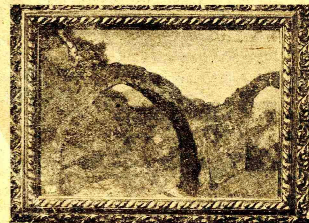
ΜΙΧ. ΟΙΚΟΝΟΜΟΥ : ΓΕΦΥΡΙ