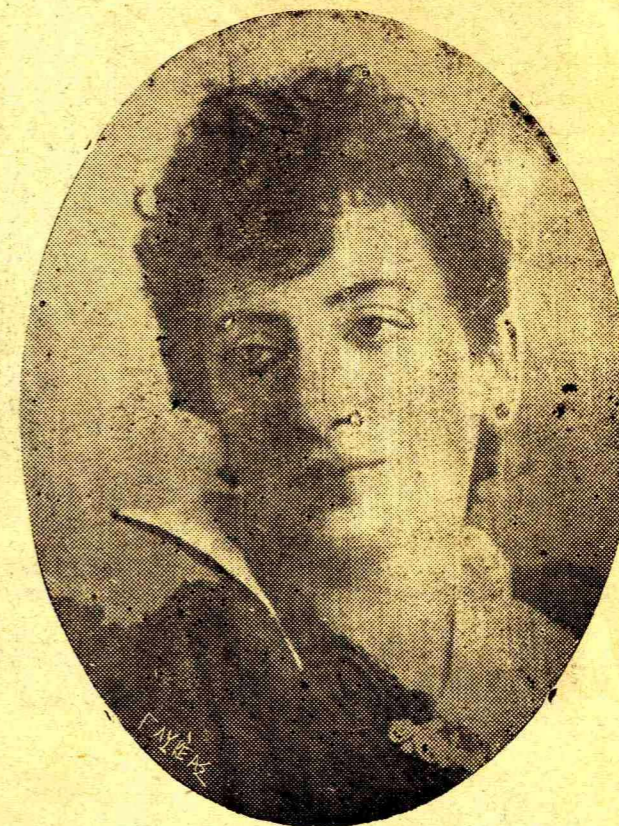
ΣΤΟ ΡΟΛΟ ΤΗΣ "ΟΦΗΛΙΑΣ", (ΣΤΟ Η ΑΜΛΕΤ) ΤΟΥ ΣΑΙΚΣΠΗΡ