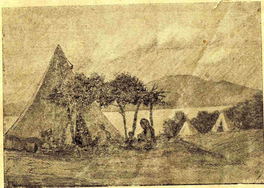
Αθ. ΤΑΡΣΟΥΛΗ: 1) ΣΤΕΓΕΣ ΚΟΡΩΝΗΣ. 2) ΠΡΟΣΦΥΓΙΚΟ ΤΣΑΝΤΗΡΙ.