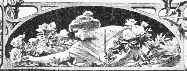
ΠΕΡΙΤΑ ΔΕ ΠΙΣΤΕΙΣ ΖΑΓΟΥΡΑΚΙΣ

ΟΡΓΑΝΟΝ ΤΟΥ ΟΜΩΝΥΜΟΥ ΦΙΛΟΛΟΓΙΚΟΥ ΣΥΛΛΟΓΟΥ