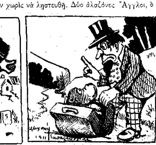
Ὁ Παῦλος ἦτο ὄνομα