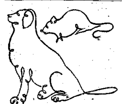
Σαγαράστε τά βφα ταύτα διά μονοκονδύλιας.

Διά της προστριβής της ψήκτρας άπό του έρωματος του υποδήματος παράγεται ηλεκτρισμός, όστις έχει την ιδιότητα να άποκρυσταλλώνη τον άνθρακα. Η άλοιφή των υποδημά-