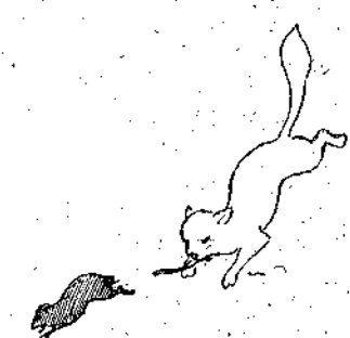
Καὶ ἀπὸ τότε τοῦ ἔμεινε τὸ ὄνομα Κολοβός.

Αὐτὸ, μικροὶ μου ἀναγιώσκται, πολλές φορές θὰ τὸ ἀκοί- σατε, ἀλλὰ ὑποθέτω ὅτι πολὺ ἐλίγαι ἀπὸ σὰς, θὰ γνωρίζετε, ὅτι εἶναι ἓνα ποντικίσιον τραγοῦδι—βλέπετε ὅτι καὶ τὰ πον- τικία ἔχουν ποιητὰς—σὰς παρακαλῶ λοιπὸν νὰ δώσετε προ- σοχὴν εἰς τὸ ἔργον παραμυθῆαι, κοῦ θὰ σὰς δέχηθῶ.