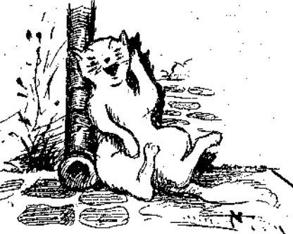
Καὶ ἡ καλὴ μὰς ἡ γάττα ἔβασάνισε τὸν νοῦν τῆς πῶς νὰ ξεγελάσῃ τὰ τροφεροῦδια τῆς...