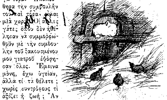
Καληνῶντα σας, καληνῶντα σας, ἀγαπημένα μου... λέγει ἡ γάττα πάλιν μὲ προσποιητῆ φωνή.