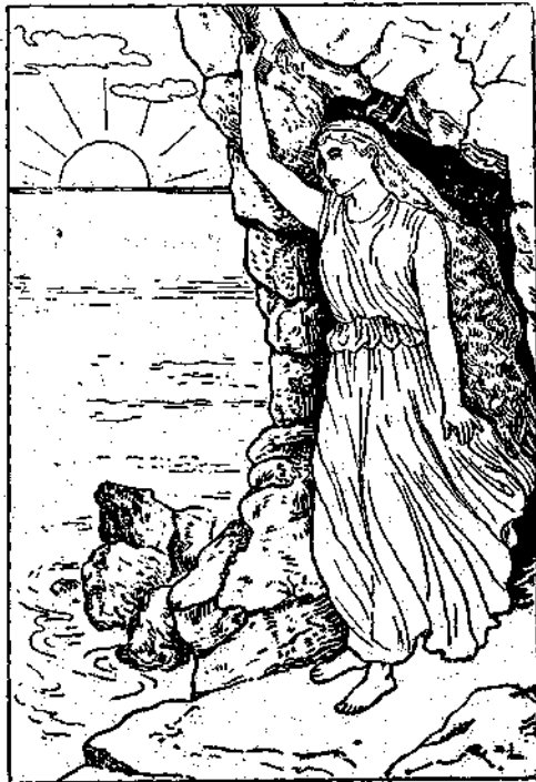
Καὶ ἡ Ψυχὴ, μ' ὄλον ἔπου ἦτο γενναία, δὲν ἀγρίως νὰ λιποθυμῆσῃ μὲν εἰς τοὺς ἐρημούς βράχους

Ἡ Ψυχὴ δὴ μὴς ἐκούνησε τὸ κεφάλι τῆς καὶ λέγει: Προτιμῶ νὰ μὲ φάγῃ αὐτὸ τὸ τρομερὸν θηρίον, ἀγαπητέ μου πατέρα, παρά νὰ