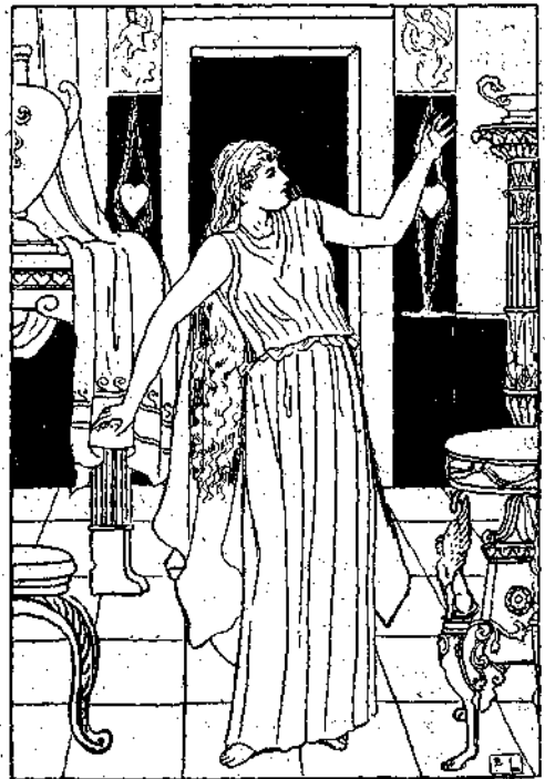
Ἡ Ψυχὴ πηγαίνει σιγὰ-σιγὰ εἰς τὸ διαπλανὸν δωμάτιον, πέραν ἓνα λόγγον καὶ πλησιάζει μὲ τὰ νύχια εἰς τὸ κρεβάτι τοῦ ἀνδρός τῆς

Ἔσπευσε τὸ βῆμα τῆς καὶ σὲ λίγο ἔφθασε εἰς μίαν ἀγυιὰ τὴν αὐλόπορταν, ἐπέρασε διὰ μέσου ὠραίου κήπου καὶ εἰσῆλθε εἰς τὸ χρυσοῦ καλὰτι.