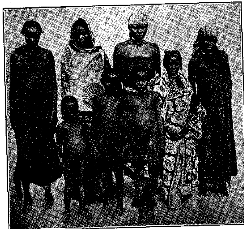
Κάτοικοι του Γαλλικου Κόγγου (Βρανσενβίλ).

Οι κατοικοῦντες τὸ όροπέδιον Νιάμ-Νιάμ τρώγουν τούς αιχμα- λώτους των και τούς νεκρούς, των όποιων τὰ πτώματα δέν ύ- περαπίζει ή οικογένεια των. εκτός εκείνων, οι όποιοι έχουν διγμα- τικὴν νόσον. Άλλη δέ φυλή του Κόγγου οι Άκκίς κυνηγοῦν τόν ανθρόπον ως θήραμα φωνάζοντας, Πίχιο! Πίχιο! (κρέας κρέας) συλλαμβάνουσι δέ τὸ ανθρόπινον κυνήγιόν των με παγίδας ή με βέλη δηλητηριασμένα. Είς μίαν δὲ άλλην φυλήν επικρατεῖ ή συ- νήθεια, ίνα τὰ παιδιά πωλοῦν ή ανταλλάσσου τὰ πτώματα των ά- ποθανόντων γονέων των με πτώμα- τα άλλων.