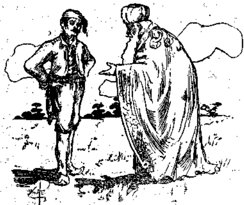
Τό φοβερότερον είναι τό κίτρινο και παγωμένο φίδι μέ τά έννιά κεφάλια!

Ο δεύτερος γέρος τούπε ν' αντιχώση τόν άλλον τους αδελφόν, τόν πειό γερνότερον, κι' αυτός χωρίς άλλο θά 'ξέυρη και αν δέν 'ξέυρη αυτός, κανείς άλλος στόν κόσμο δέν ήμπορεί νά 'ξέυρη, γιατί είναι επάνω από 150 χρονών και είδαν πολλά τα μάτια του.