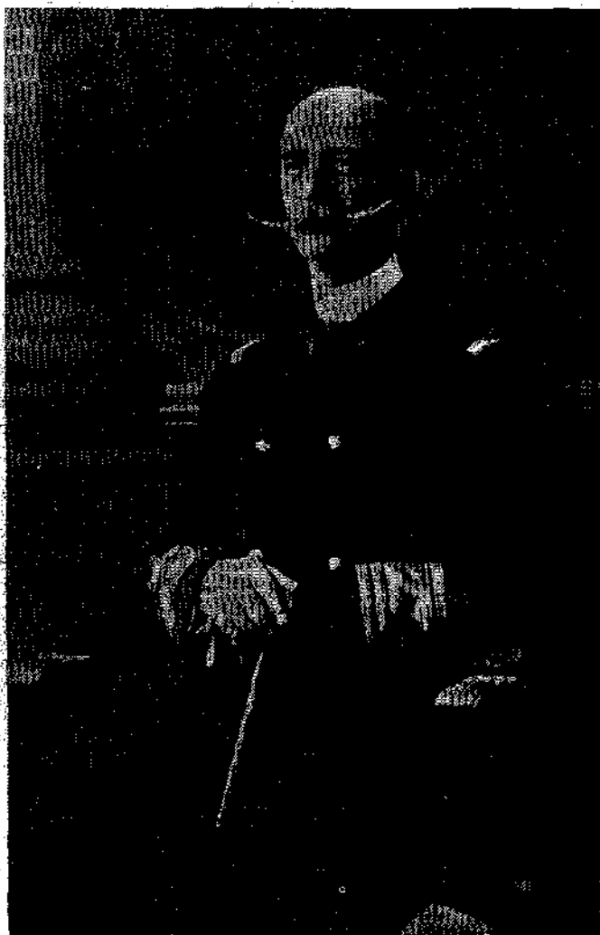
Ὁ ἐν Θεσσαλονικίᾳ δολοφονηθεὶς ἡ 5 Μαρτίου Βασιλεὺς ἡμῶν Γεώργιος Α'.

Ποῦ τὸν ξέρω; Ἄμην ἔχομε... πιστὴ μαζί!.. Στὸ ἴατοί κάθε χρόνο κάνει γιορτὴ καὶ πάμε ὅλοι ἀπὸ τὸ Μενίδι, ἀπὸ τὰ Λιόσια, ἀπὸ τὰ Κιοῦρα. Μᾶς κάμνει διάφορα παιγνίδια. Ἄ! ἐκεῖ εἶμαθα ὅλοι ἴσοι... Ἡ γὰρ σοῦ πῶ πᾶς μὰ ἡμέρα μὲ τσάκισι! Εἶχε βάλει ἕνα πατόξυλο, ἴσα μὲ δέκα μέτρα μᾶκρος, μισὸ μέτρο ἐπάνω ἀπὸ τὸ χῶμα, τὸ ὅποιον ἐστερῆζα εἰς τὸ ἕνα ἄκρο καὶ στὸ ἄλλο μόνον. Ὅποιος τὸ περάσει αὐτὸ μᾶς λέγει μάλιστα ἐτελείωσ' ὁ χορός—ὁ βασιλεὺς γιέ—νὰ πάρῃ αὐτό: καὶ ἐκάρφωσ' ἐπὶ τὴν