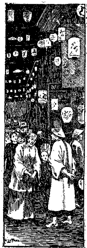
Ἐὰν ἀκούσει, παιδί μου, ἀπὸ τὴν Γαλιὰ μου, εἶπεν ἡ γῆρά, διὰ τὴν ἀρχαία ἐποχὴ δὴ ἓνα πτωχὸς Βάγγ-Σιχ, τὸν ὅποιον ἐμάγαπαν τὰ πνεύματα τοῦ βουνοῦ.

— Αὐτὸ πρέπει νὰ κάμω— ἐρώναξεν εἰς τὸ τέλος. Ἐσορε ἓνα σπέρτο καὶ ἄναψε μ' αὐτὸ τὰ χορτάρια τοῦ