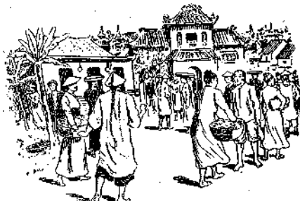
Ὅταν ὁ Βάγγ-Σιχ ἐπέστρεψε εἶδε εἰς τὸν τόπον τοῦ χωρίου του μίαν πόλιν μεγάλην.

Ὁ Βάγγ-Σιχ, ἀροῦ εἶδε ὅλα αὐτὰ ἔφυγε ἀπὸ τὴν πόλιν αὐτὴν καταλυπημένος. Ἐκοιμήθη εἰς τὸ βουνό, ἔπειτα ἀνωρίς, τὴν ἐπομένην πρωΐαν, ἐγύρισε πίσω εἰς τὸ σπήλαιον ὅπου ἔπαιζαν οἱ δύο γέροντες.