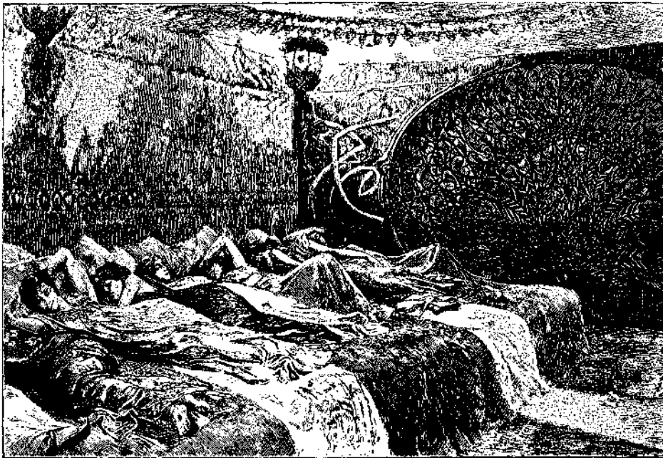
Μόλις τα ποντικά έμβηκαν εις το δωμάτιον, είδαν τα έννέα πετράδια εις τα μέτωπα των εύνοουμένων του Σουλτάνου.

τον έσωσες; διέκοψεν η γργά. Είσαι ένα καλό παιδί. Έσωσες την ζωην του άρχηγού της φυλής μου. Διότι πρέπει να γνωρίζης ότι αυτή είναι μία φυλή, της όποιας εγώ είμαι βασίλισσα. Μού φέρουν φρούτα από το δάσος και εγώ τους αλείφω με ένα φάρμακο πούτους προσφυλάττει από τα δαγκάματα των φσιδιών.