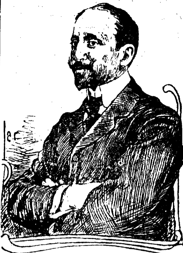
Ο ποιητής του "Ονειρου φθινοπωρινής εσπερας"