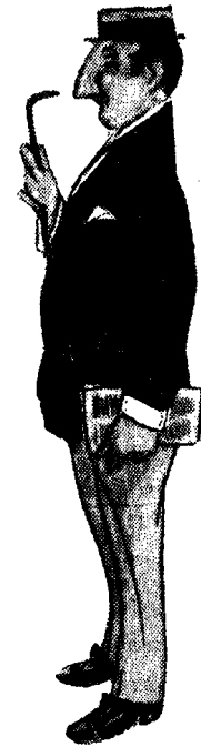
ΝΙΚΟΛΑΟΣ Ο ΠΟΡΙΩΤΗΣ