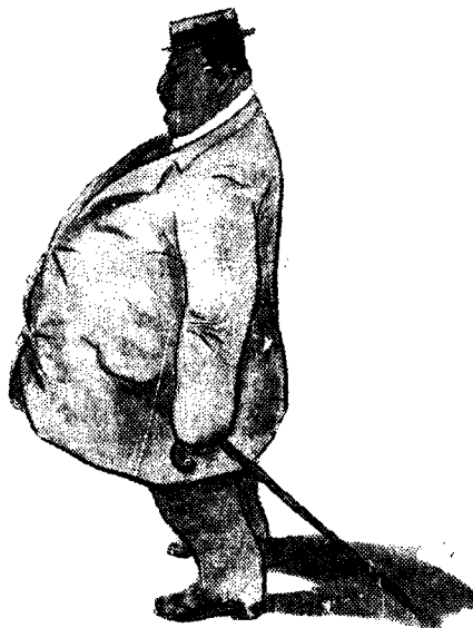
ΦΙΑΛΗΤΑΣ Ο ΓΡΑΜΜΑΤΙΚΟΣ