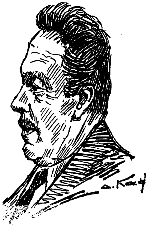
Λίγες μέρες πρὶν πεθάνει.