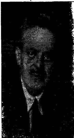
Τελευταία φωτογραφία του, κλονομένη στοῦ ἀτελιῆ τῆς Nelly's.