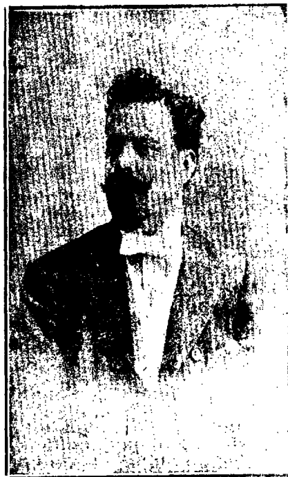
Όταν άρχισε τó «Νουμά»

και τής πισωδρομική δημοσιογραφίας. Ανίμεσα στη σύγκρουση και στο ζύμωμα ιδεών και συστημάτων γλωσσικών, κοινωνιολογικών και πολιτικών κρατά την ίσοροπία κι άγωνίζεται να βοή ένα φωτεινό δρόμο. Μέσα άπό τά φύλλα του «Νουμά» ξεπηδούνε καινούργιες θεωρίες, εκεί συζητούνται θέματα γραμματικά, γλωσσολογικά, κοινωνικά, πολιτικά, λογοτεχνικά, εκεί πρωτοφανερώνονται νέοι λογοτέχνες κ' επιστήμονες πόν έμελλε κατόπι ν' άναδειχτούνε και ν' άναγνωριστούνε. Όσοι θυμούνται πώς είχε καταντήσει ή ζοή στην προπολεμική Ελλάδα, με τά στενά της έδαφικά και πνευματικά σύνορα, τι ξεπεσούρα και τι μούχλα την είχε κρι-